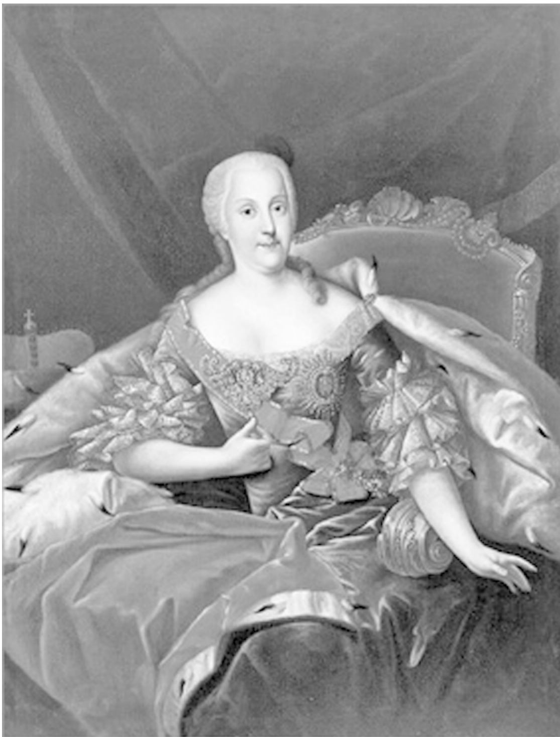
Принцесса Иоганна-Елизавета Ангальт-Цербстская (мать Екатерины II). Художник А. Пэн

Речь идет о романе с дядей как раз в разгар многозначительных намеков русского двора. Принц Георг-Людвиг вел себя слишком свободно для человека, который заранее не заручился согласием матери. «Я узнала потом, что мать все это знала, – вспоминала Екатерина, – да и нельзя ей было не заметить его ухаживания, и, если б она не была с ним заодно, то, я думаю, она не допустила бы этого».