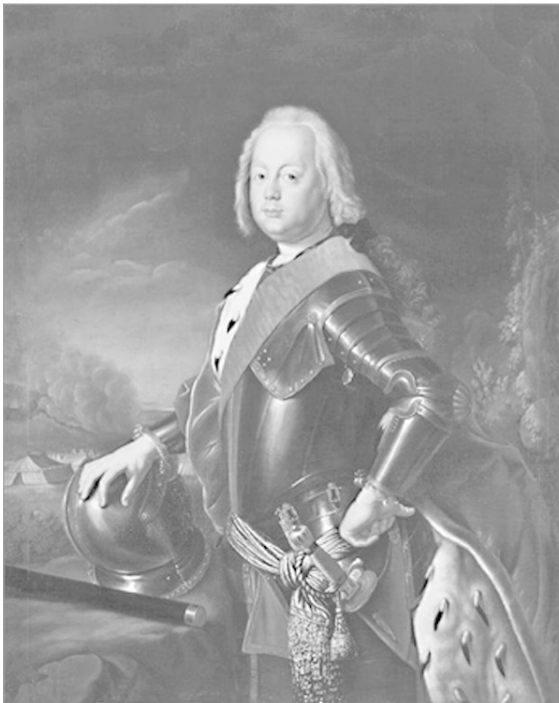
Принц Христиан-Август Ангальт-Цербстский (отец Екатерины II). Художник А. Пэн

Сознание своей ненужности развило в Софии детскую ревность. В жизни самой Фикхен братья и сестры не играли никакой роли. В мемуарах она даже не называет их имен и не испытывает грусти, когда рассказывает о смерти своего тринадцатилетнего хромого брата. Ведь это был тот самый мальчик, которого так «страстно любила» мать! Уже став императрицей, Екатерина запретила своей родне приезжать в Петербург, заметив, что «в России и без того много немцев».