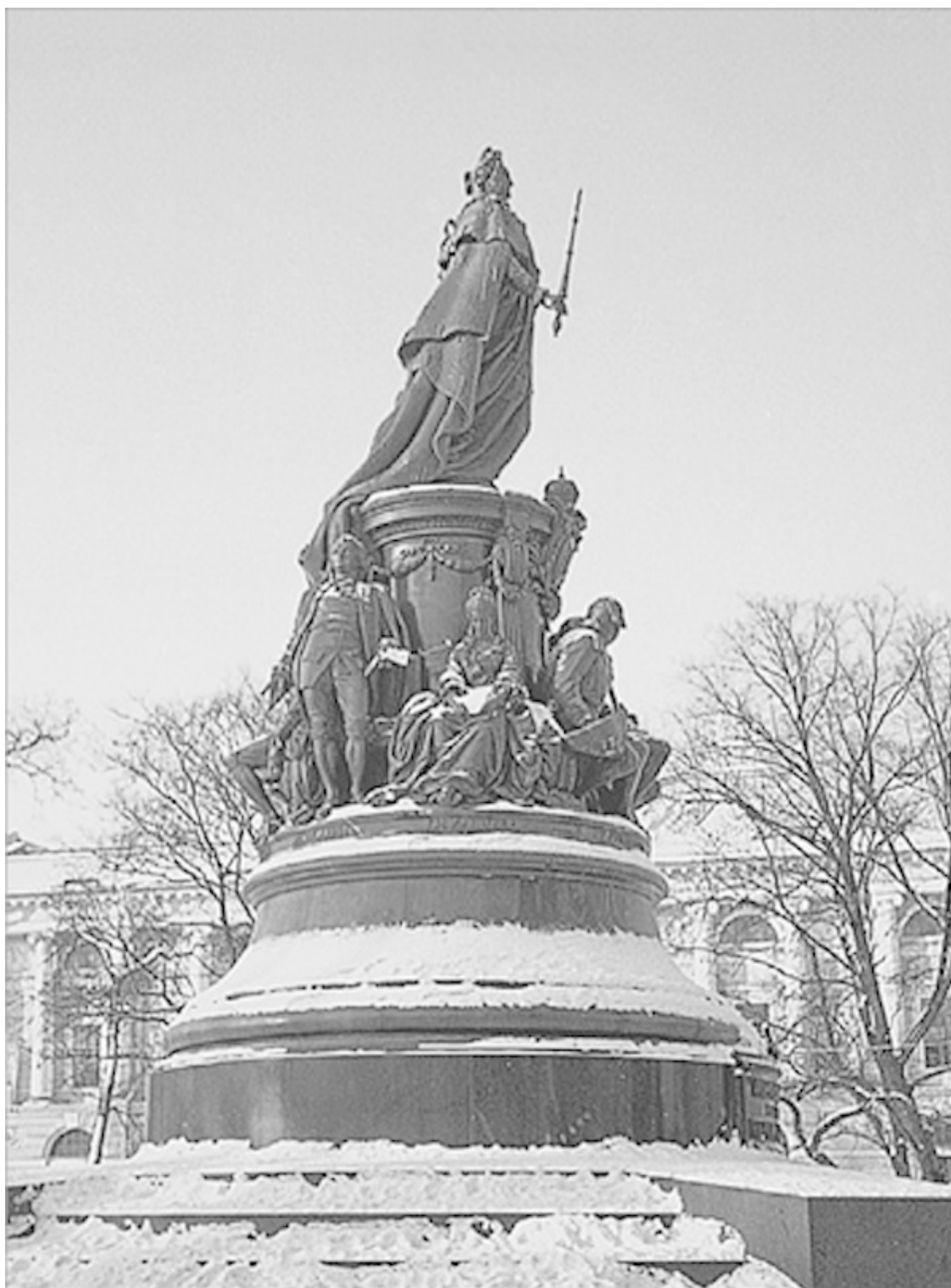
Памятник Екатерине II. Скульптор М.О. Микешин

Это краткий «джентльменский набор» того, что стоит знать о «Матушке-государыне». Теперь можно вернуться к рассказу о личности государыни.