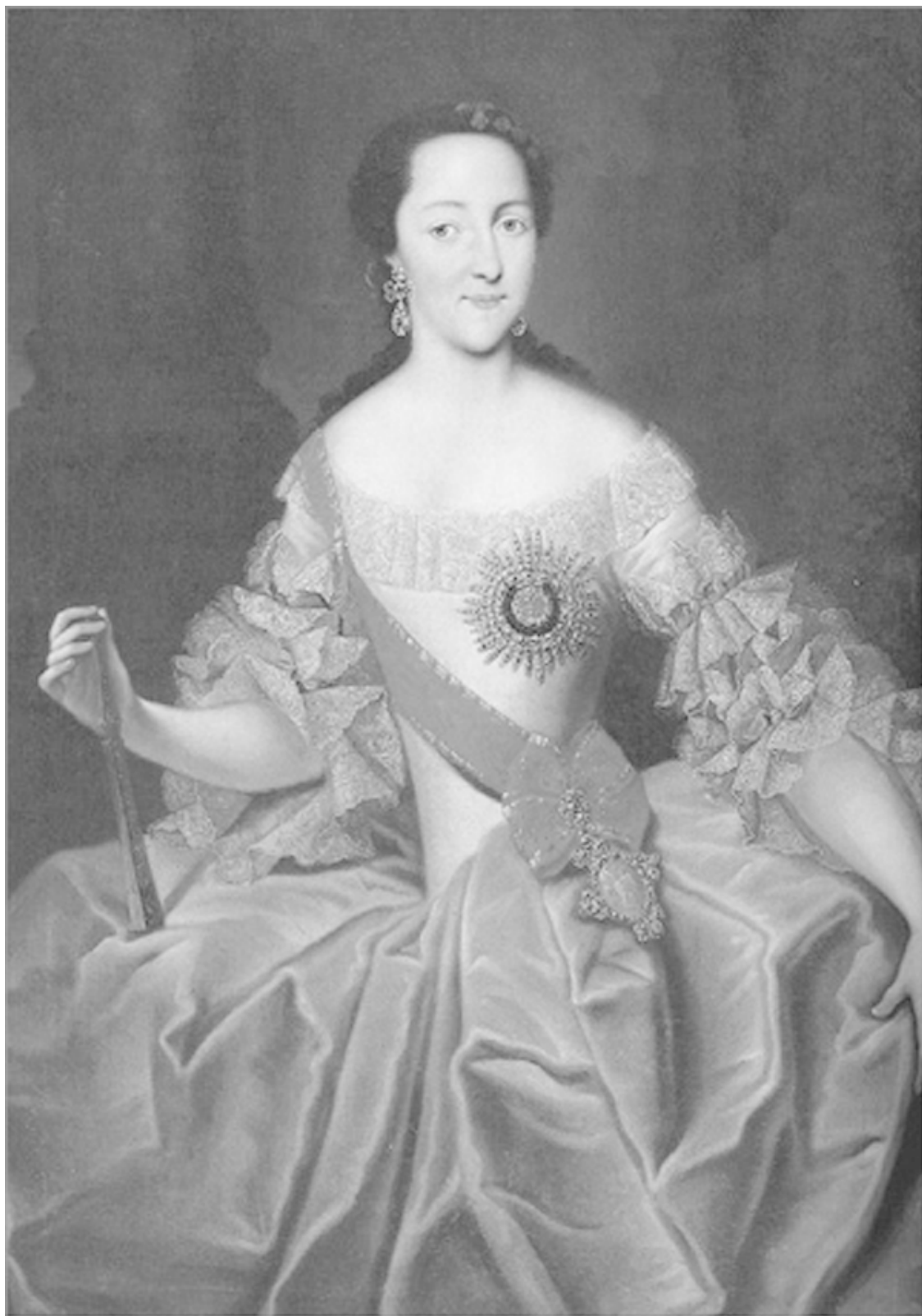
Великая княгиня Екатерина Алексеевна. Художник Г.-Х. Гроот

В конце 1750-х гг. из-под пера Екатерины вышла краткая редакция «Записок». А в 1758 г., узнав об аресте канцлера Алексея Петровича Бестужева, ее политического сторонника, великая княгиня сожгла бумаги, в том числе и биографические заметки. После переворота 1762 г. молодая императрица написала еще две редакции «Записок», одна из которых почти