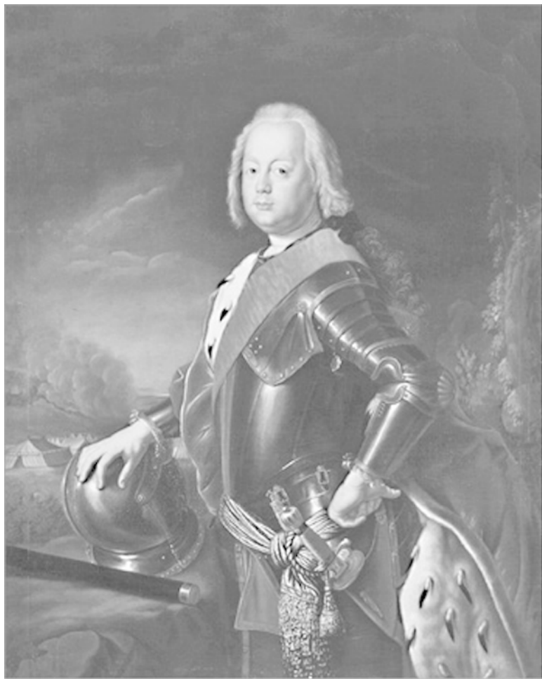
Принц, Христиан-Август Ангальт-Цербстский (отец,