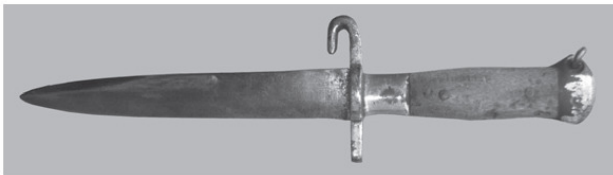
Фото 2. Боевой нож времен Первой мировой войны. Австро-Венгерская Империя 4

Наиболее удачные образцы и конструкции боевых ножей продолжают жить, как говорится, своей собственной жизнью. Их начинают копировать, форма и конструкция заимствуются и используются.