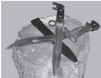
Фото 1. Два штык-ножа с одним названием – штык-нож к АК-47. Один советский, другой китайский. Как говорится, угадай с первого раза

Посмотрите на фото и, как говорится, почувствуйте разницу или найдите пару отличий. Сверху расположен советский штык-нож к АК-47. Ему более 50 лет. Снизу – современный китайский «показательный» образец. Хотя и есть на нем надписи «АК-47» и «СССР», образец выдержал только несколько бросков на тренировке. Повреждения – как говорится, не совместимые с дальнейшим использованием. Клинок легко гнется руками в любую сторону.