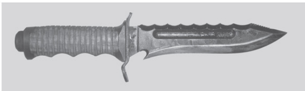
Фото 2. Современный российский боевой нож «Катран»