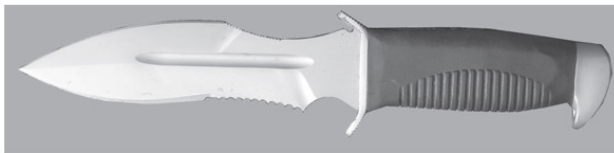
Фото 1. Современный российский боевой нож «Взмах»

Любой нож может быть боевым. При условии, если с его помощью можно выполнить боевую задачу. И такой задачей не всегда и не только является применение ножа в рукопашной схватке (фото 1—3).