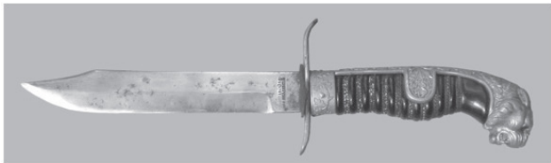
Фото 4. Боевой нож разведчика времен Великой Отечественной войны с рукояткой от трофейной немецкой сабли. Привезен на память с войны ветераном из Вены (Австрия)

О нечто похожем часто рассказывали ветераны Великой Отечественной войны. Наряду с личным ножом отечественного производства часто многие использовали трофейные образцы. И удобно, и по-современному модно. Да и чаще всего эти ножи брались на память или использовались для открывания консервных банок, называвшихся тогда «вторым фронтом» (фото 4).