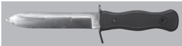
Фото 1. Боевой нож бундесвера, ФРГ – Германия, 1969 г.

Боевые ножи иностранного производства, несмотря на то что приняты на вооружение в соответствии с иным законодательством, по иным нормам и правилами, всегда остаются ножами боевыми. И их принадлежность к таким ножам может определить только специальная экспертиза (фото 1—2).