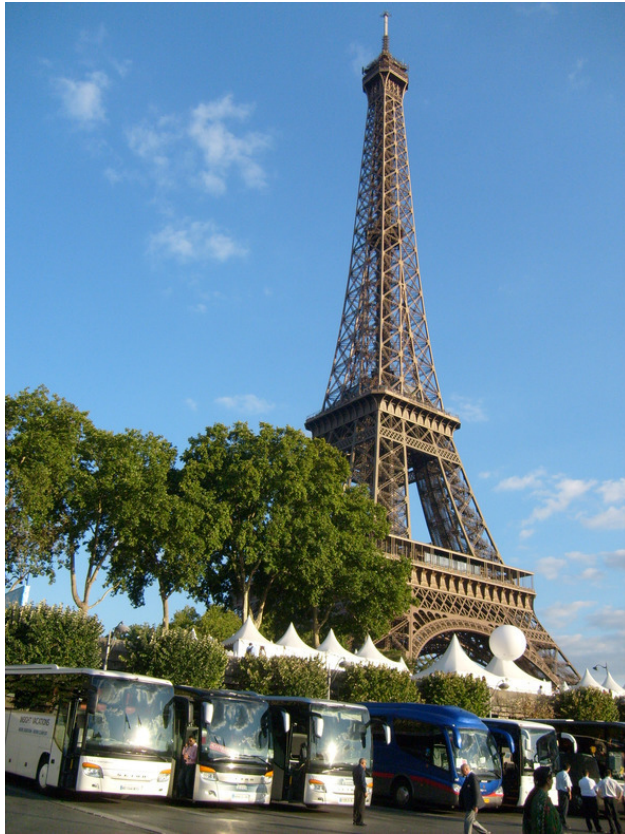
Франция. г. Париж. Эйфелева башня. 2011 год.