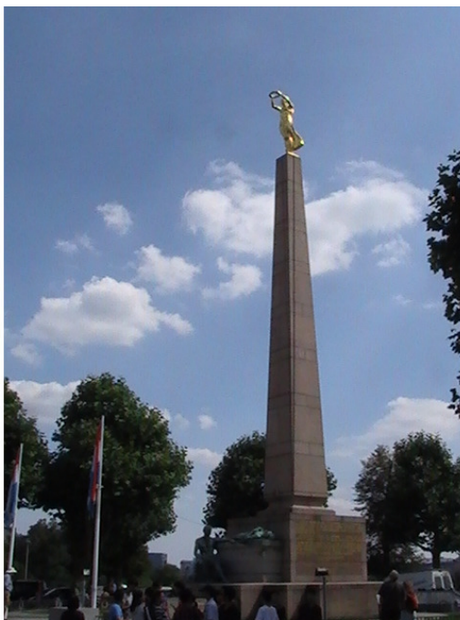
Люксембург. Стела с женщиной с венком в руках. 2011 год.

Накормили в ресторане обедом и снова поехали через Германию, Братиславу столица Словакии в Прагу столица Чехии.