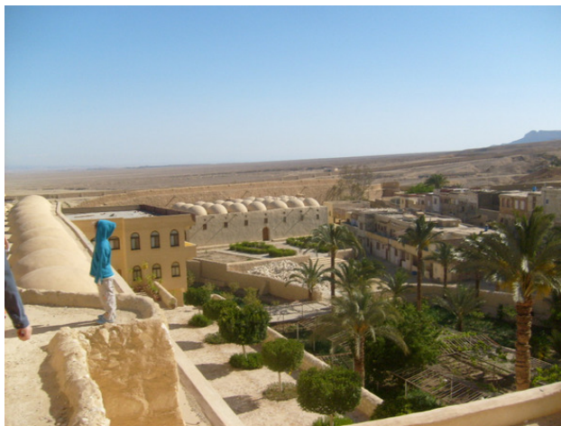
Египет. мужской монастырь св. Великого Антония и св. Павла. 2009 год.

В три часа дня мы поехали на Синай, где находится мужской монастырь Святой Екатерины. Не далеко от Красного моря в оазисе располагался промежуточный отель, где паломники отдыхали перед походом на гору Моисея.