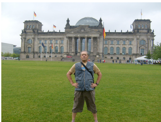
Германия. г. Берлин. Рейхстаг. 2011 год.

Автобус катился по Германии, удивляя нас, россиян, аккуратности и порядком на дорогах и вдоль дорог. Нам бы так наводить в своей стране порядок и дисциплинированность. Не далеко от границы с Францией автобус остановился у отеля на ночлег. Уже наступал вечер, мы устали от дороги. Поужинали и разбрелись по номерам.