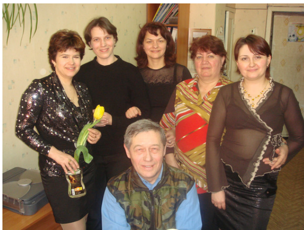
«УЗРЭМ». Я и коллектив завода. 2010 год.

...Мне 65 лет – это не мало прожито для человеческой жизни. Жизнь прожить не поле перейти, так говорит русская народная поговорка. Свои мысли и убеждения я записал в первой части своих авторских записок. Человечество и человек становятся жестокими и лживыми, особенно политики и первые лица государства. Европа в виде Единого Союза и США, а они являются оплотом душителей инакомыслия суверенитетов государств и покушаются на их свободу. Бомбят города и населённые пункты, убивают мирное, гражданское население. Россия приобретает самостоятельные очертания своего государства. Ведёт независимую политическую и экономическую деятельность. Даже сдерживает агрессию США к другим слабым странам, которые мотивируют тем, что страны являются источникам терроризма и прочее. Идёт процесс деления сфер влияния в политической и экономической сфере деятельности человечества. Это касается больших и мощных государств. Прежде всего, США и Европы. Чем дальше, тем становится ясным, что дальнейшая обстановка между странами будет ещё напряжённей и приведёт к локальным войнам. Не дай Бог к третьей мировой войне с применением ядерного оружия.