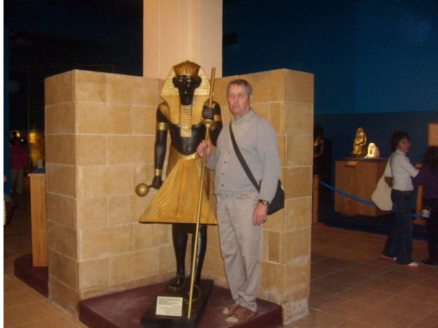
Египет. г. Хургада. У статуи фараона. 2010 год.

Посетили магазин папирусов, красивые картины. Фабрику по изготовлению масел. Всё это познавательно.