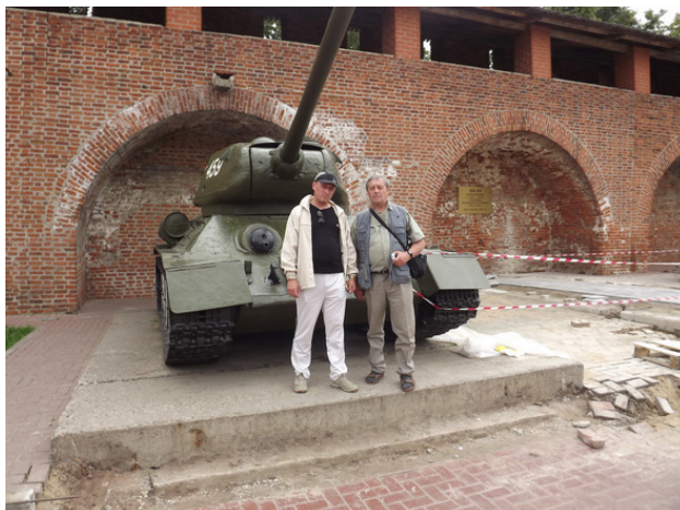
г. Нижний Новгород. Крепость. 2012 год.