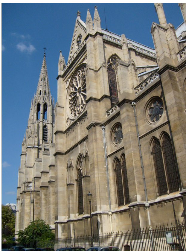
Франция. г. Париж. Пантеон. 2011 год.

Я увлёкся фотографированием и спохватился, что нужно идти к автобусу. Спустился с башни и стал искать автобус на причале №3. Бегаю вокруг да около башни, а найти автобус не могу. Стал волноваться, в Париже один, кругом чужие люди. Бегом на пристань, автобусов много, но я знаю номер. Стал искать и нашёл. Смотрю, гид занимается своими бумагами.