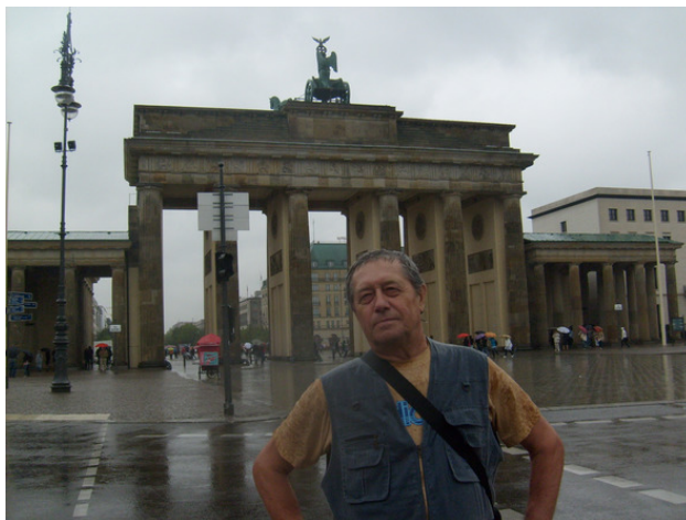
Германия. г. Берлин. Бранденбургские ворота. 2011 год.

Дождь лил, мокрый я снимал на фотоаппарат и кинокамеру. Останется на память.