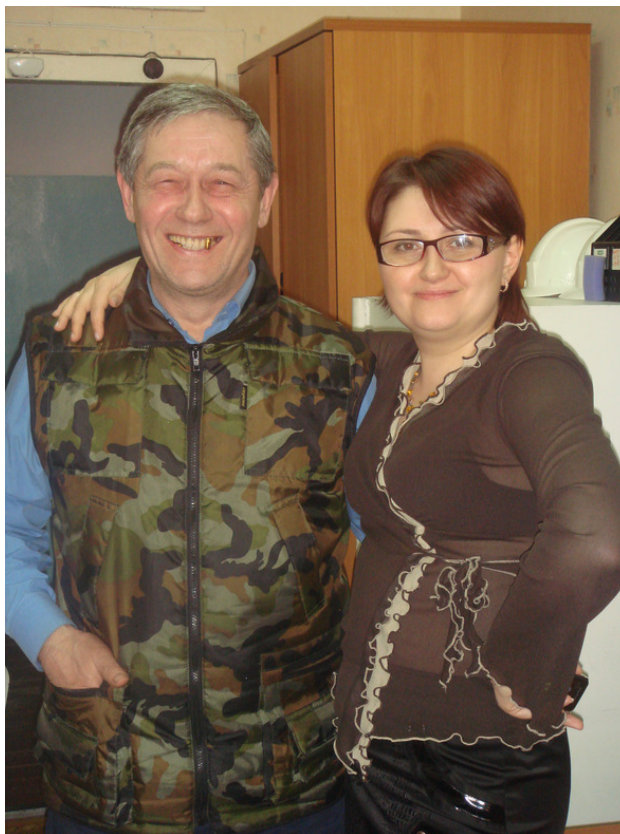
«УЗРЭМ». Я и секретарь общего отдела. 2010 год.

С коллективом у меня отношения были нормальные. Без конфликтов не бывает. Постепенно мне стало психологически тяжело работать здесь. Мне сделали пол – ставки механика, хотя всё лето работал полный рабочий. Но мне было тяжело осознать такое положение, и постепенно я стал склоняться к тому, чтобы уволиться. Психологически я стал не переносить атмосферу на заводе, руководство, само производство. Надоели краны, оборудование и железо. Куда не кинься, проблемы. Я серьёзно стал подумывать об увольнении с завода.