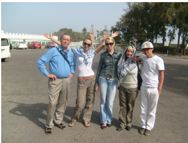
Египет. г. Александрия. Я и туристы. 2010 год.

На море не ходил, солнце сильно пекло. Апрель, а что летом творится. Можно сгореть заживо. Обгорело лицо и тело. Ходил в одежде, чтобы закрыть открытые места тела. Простуда на губах высыпала сильно, так и приехал домой обгорелый, и с больными губами. Две недели заживали.