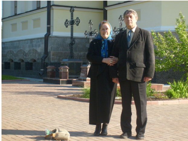
Верхнестуринск. Мужской монастырь. 2009 год.

Приехал из поездки по Египту. Отдохнул душой и телом. Вышел на работу, но большого желания не было. Всё лето работал полный рабочий день. Много работы было на других участках. Монтировали кран балку на втором участке фабрики №6. На третьем участке монтировали новое оборудование, большой токарный станок, меняли тельфер на кран – балке.