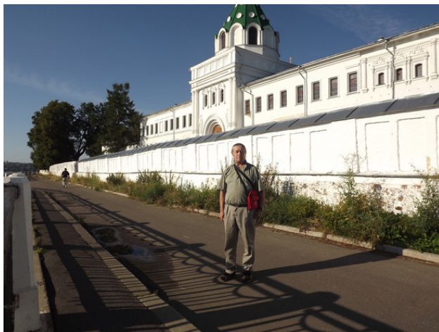
г. Нижний Новгород. Мужской монастырь. 2012 год.