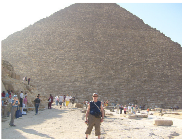
Египет. Гиза. Пирамида Хеопса. 2008 год.

Пришли. Песок, скальные берега, виден пролив и бес крайное Красное море. Чайки летают над морем и кричат свои песни. Летают парашюты за катерами, теплоходы плавают. Стоят теплоходы от берега метров 400 и туристы плавают и смотрят под водой кораллы и рыбки.