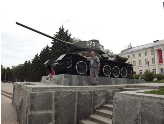
г. Нижний Новгород. Я у танка Т – 34. 2012 год.