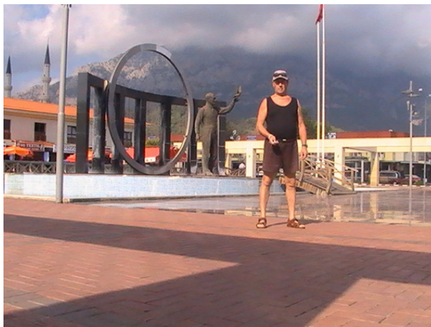
Турция. г. Кемер. 2010 год.

Третий раз я отправляюсь за границу, в этот раз в Турцию. Я вылетел из Екатеринбурга на большом самолёте «Боинг». Эта большая птица произвела на меня большое впечатление. Она вмещает 360 человек. Время вылета было 14 часов 15 минут. Погода стояла прекрасная, и с высоты 10000 метров было хорошо видно поверхность земли с её реками, озёрами, лесами и полями. Вот пролетаем Чёрное море от северного берега до берегов Турции. Курортные города тянутся по всему берегу Турции. Красота.