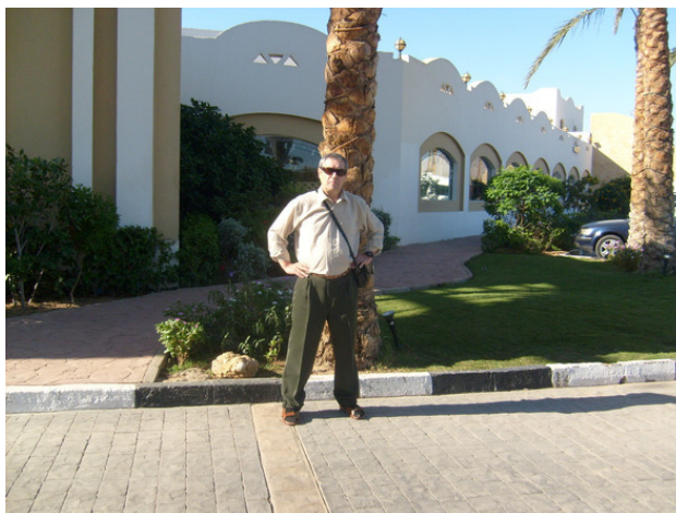
Египет. Шарм-ель – Шейх. Отель «Coral Hills». 2008 год.

Впервые в жизни я решил побывать за границей и начал с экзотической страны Египет. Купил путёвку за 31000 рублей, Шарм – ель – Шейх, 4* звёздный отель Coral Hills, что означает коралловый дом. Дорогая путевка оказалась. После 10 декабря можно купить горящую путёвку за 10000 рублей. Не было у меня тогда опыта в покупке путёвок за границу.