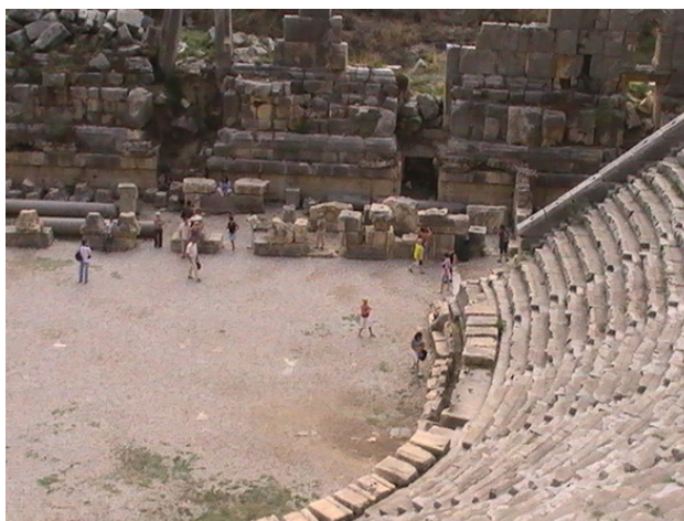
Турция. г. Миры – Демре. Древний амфитеатр. 2009 год.

Прогулка по морю прошла благополучно, много осталось впечатлений и счастливых минут.