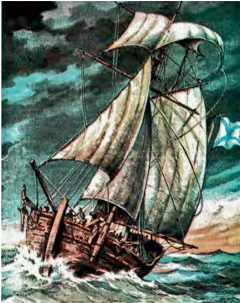
Дубель-шлюпка «Якутск» в море