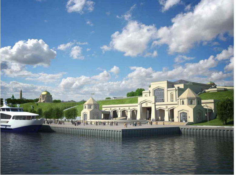
Фото. 5. Болгар. Пристань на реке Волга

ясняется одним из правил образования языковых диалектов за счет чередования согласных и гласных.