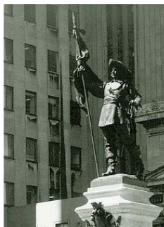
Фото 1. Статуя на площади Плацдарм в Монреале

В 1652 году ему пришлось снова уехать во Францию, где он нашёл сто добровольцев для защиты Монреалья. Когда с этой сотней он вернулся в Монреаль, там оставалось только 50 поселенцев – остальные вынуждены были бежать в Квебек. Скоро колония усилилась настолько, чтобы противостоять нападениям. В 1665 году Мезоннёв был отозван во Францию. Он умер в Париже всеми забытый в 1676 году.