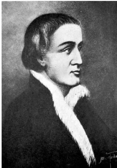
Рис.2. Поль Шомеди, сьёр де Мезоннёв

Родился в аристократической семье в провинции Шампань (Франция). Начал военную карьеру в возрасте 13 лет.