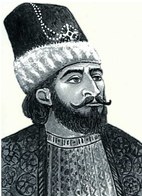
Рис.3. Панах-Али-хан, Карабахский хан 1747 – 1763 г.г.

Панах Али-хан, Панах-хан (азерб. Pənah Əli xan; 1693 – 1763) – создатель и первый правитель Карабахского ханства, основатель ханской династии Джеванширов. При нём к Карабаху были присоединён Зангезур и поставлены в зависимость ханы Гянджи, Нахичевани, Эривани и Ардебилля, а также ликвидировано самоуправление армянских меликов (правителей) Нагорного Карабаха.