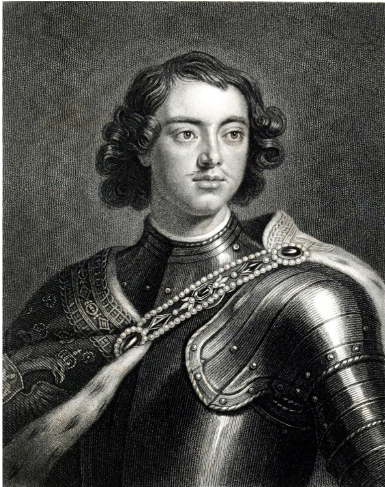
Рис.1. Петр I, основатель Санкт-Петербурга