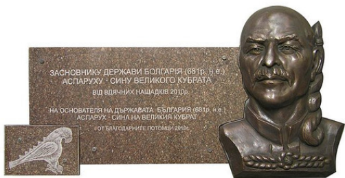
Фото.4. Памятная доска Хану Аспаруху. Открыта в декабре 2010 г. в Болгарии на Дунае

Примечательно, что Волжская Булгария – первое полноценное государство в Восточной Европе, со всеми атрибутами государственной власти, и признанное мировым сообществом в раннем средневековье, о чем говорят древние западноевропейские и восточные источники, карты, мировая торговля и дипломатия тех лет.