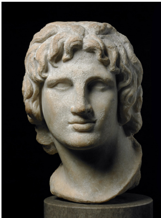
Фото 3. Александр Македонский – величайший завоева-

ло лишь поселение Ракоте или Ракоти (коптско-саидский rakote, бохайрский rakot – «основанное богом Ра»), где уже при фараонах Саисской династии (VII – VI вв. до Р. Х.) селились греки. Впоследствии это имя носил один из кварталов, а египтяне называли так сам город.