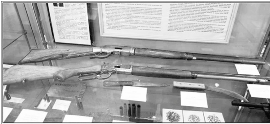
Экспонаты Эгвекинского краеведческого музея

Ночью моросил мелкий, противный дождь. Я вышел из балка. Туман тихо и безмятежно висел ниже середины сопок. На противоположной стороне галечной косы, под плотным одеялом серого тумана, плавно поднималась и опускалась тёмно-зелёная поверхность воды. Море дышало.