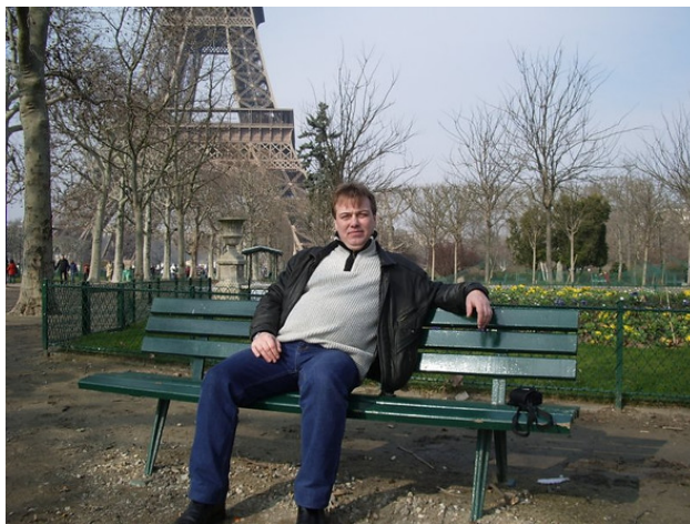
Фото автора Стригина Александра

Стригин Александр талантливый поэт-песенник. Им написано около 230 песен, из них 97 песен в соавторстве с другим композитором или певцом.