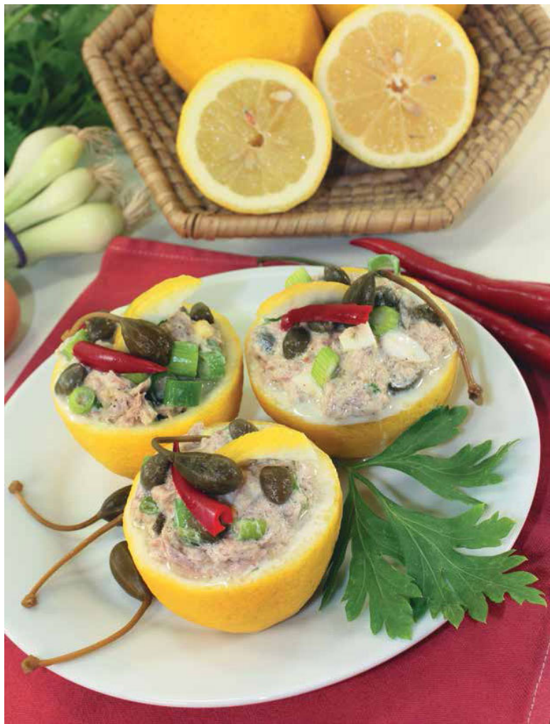
Лимоны, фаршированные тунцом и каперсами