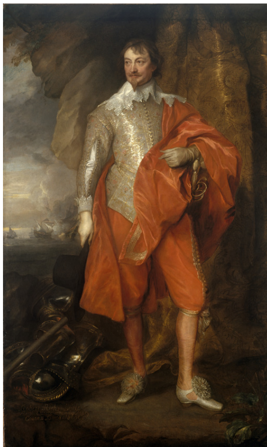
Роберт Рич, 2-й граф Уорвик. Художник Антонис ван Дейк.

15 июня в протоколах КОП было записано, что «плантаторы острова Тортуги просили компанию взять их под свое покровительство и позаботиться об их укреплении за вознаграждение из одной двадцатой части продуктов, производимых там ежегодно». В тот же день руководство КОП приняло окончательное решение о принятии Тортуги под свою протекцию.