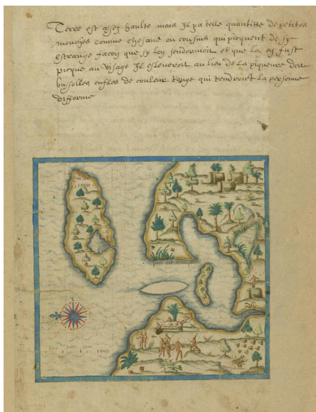
Тортуга и гавань Пор-де-Пэ на испанской карте 1602 года.

21 января 1635 года испанские суда подошли к гавани Бастера, защищенной небольшим фортом с шестью пушками, и, не рискнув высадить десант в этом месте, переместились на запад – к селению Кайон. Там все суда неожиданно сели на мели и рифы, прикрывавшие вход в Кайонскую гавань. Согласно данным двух сохранившихся испанских отчетов (от 16 января и 12 июня 1635 года), на острове и на стоявших в гавани трех флейтах 21 и одном паташе 22 в то время находилось около 600 человек, включая женщин, детей и рабов. Несмотря на аварию, Фуэмайор высадился на берег с 30 солдатами и двинулся прямо к дому губернатора. Во время короткой стычки пятнадцать защитников острова и «губернатор» были убиты (в действительности испанцы приняли за губернатора одного из офицеров; губернатор Кристофер Уормли проявил трусость, бежал и позже уплыл на одном из стоявших в гавани судов в Виргинию).