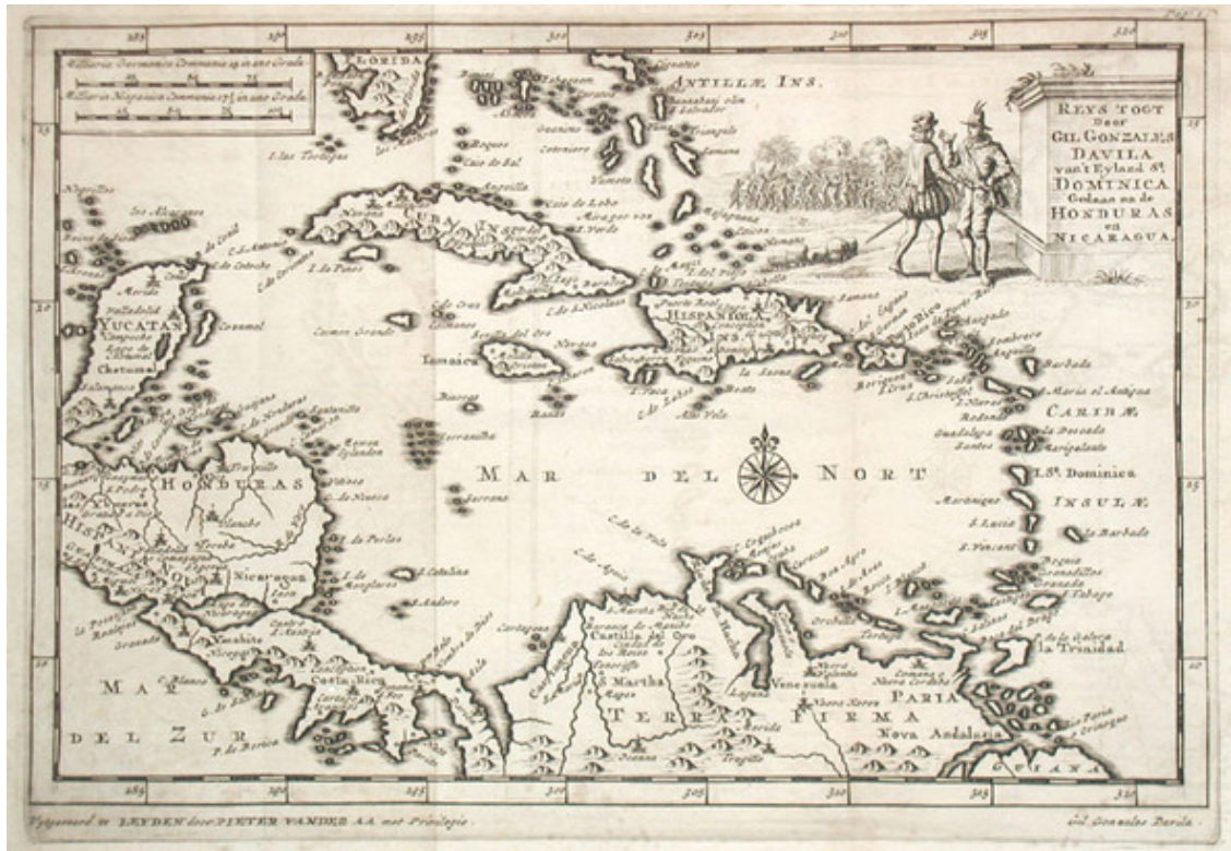
Карибское море на карте Питера ван дер Аа (1659—1733).