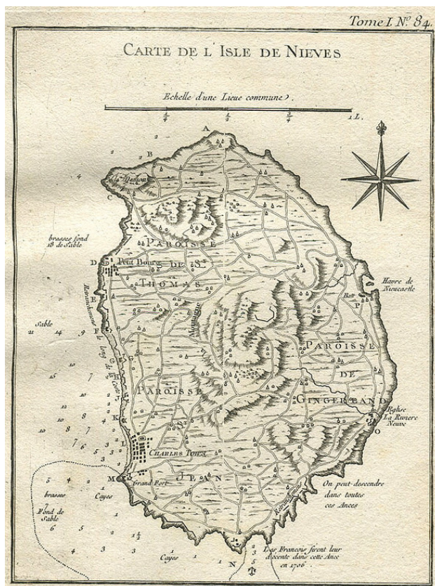
Остров Невис на французской карте колониального периода.