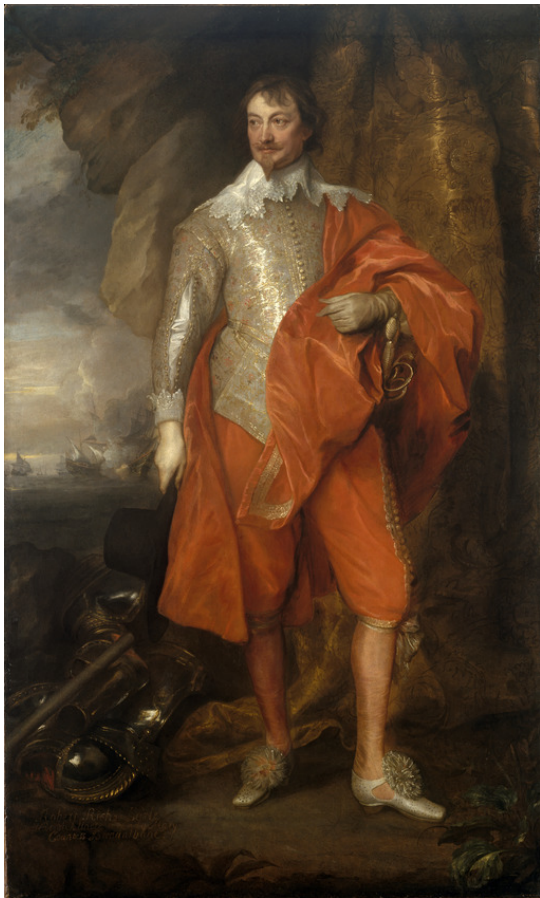
Роберт Рич, 2-й граф Уорвик. Художник Антонис ван Дейк.

15 июня в протоколах КОП было записано, что «планта-