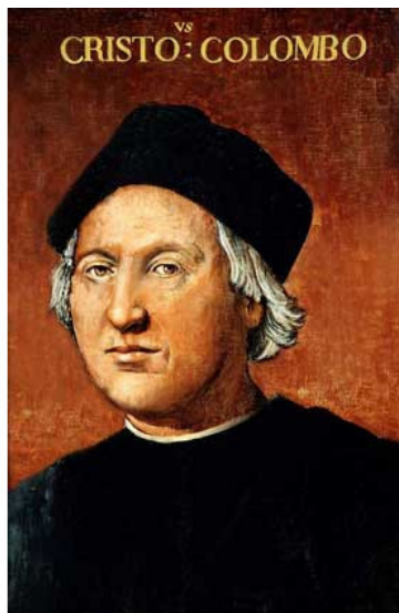
Христофор Колумб. Неизвестный художник.

На юго-востоке берег прерывался; возможно, то была река, и казалось, что в милях 20 от этого места, между мысами Слоновым и Синкин, открывался широчайший проход. Некоторые моряки различали на его противоположной стороне нечто вроде острова, который адмирал назвал «Тортуга» (Черепаша)».