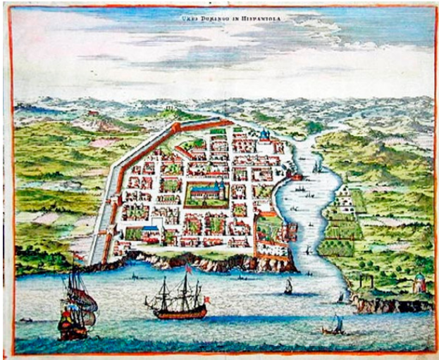
Город Санто-Доминго на гравюре XVII века.

использовались в качестве гребцов на сторожевой галере в Санто-Доминго, смогли каким-то чудом освободиться от цепей и, перебив охрану, сбежать на Тортугу.