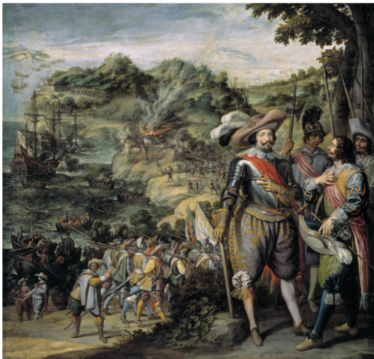
Нападение армады дона Фадрико де Толедо на острова

рех заложников, отплыл в сторону Сент-Кристофера. Местные плантаторы – и англичане, и их соседи-французы – сдались испанцам на тех же почетных условиях, что и жители Невиса. А те, кто не пожелал сдаться, бежали в лес и на соседние острова.