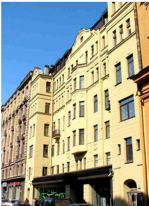
Дом №6 на Малой Посадской улице

Так они переехали жить в исторический центр Ленинграда, где совсем рядом располагалась Петропавловская крепость, знаменитый домик Петра Первого и Троицкая площадь, первая в Петербурге.