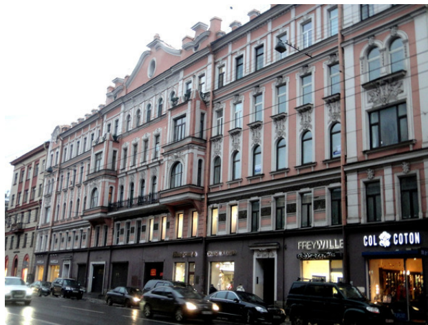
Дом 19 на Большом проспекте ПС