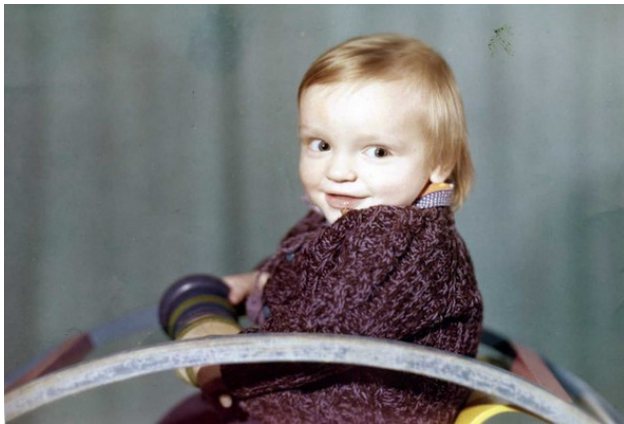
Фото сына Ильи в три года

Как часто в жизни бывает, если с одной стороны приходит радость, то с другой – жди беду. Так случилось и в семье Борисовых.