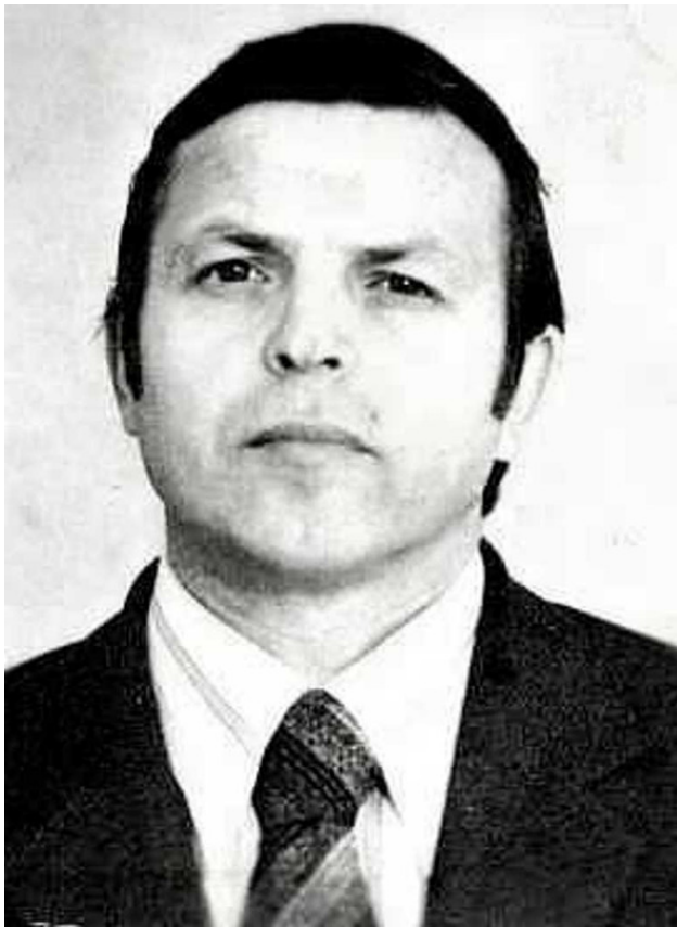
Автор книги Шишков Сергей Иванович