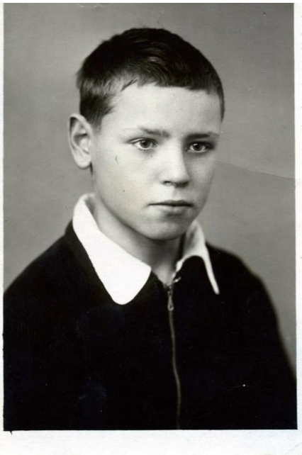
Юре 13 лет

И хотя он был малозначительный, но суровые послевоенные законы не посчитались с этим.