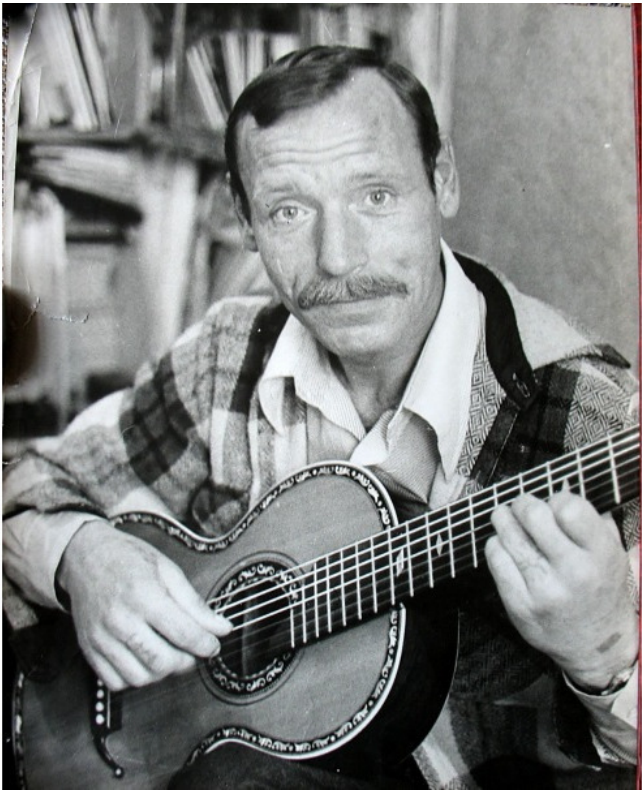
Юрий Аркадьевич Борисов, поэт и композитор