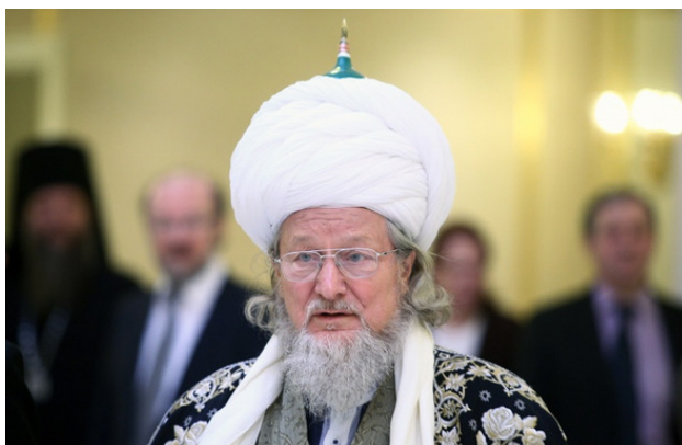
Верховный муфтий России Талгат Таджуддин

Верховный муфтий, как он ярок, Красив речами, мудр он. Он поводырь болгар, исламский старец, Наставник и учитель он.