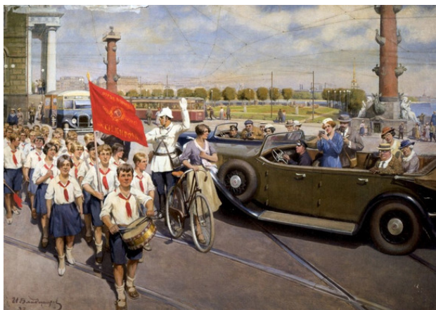
«Иностранные туристы в Ленинграде.1937 г.» худ. Иван Алексеевич Владимиров

Люблю мой город Ленинград. Люблю до одурения. Люблю твой Невский, Летний сад. Рождение снова гения.