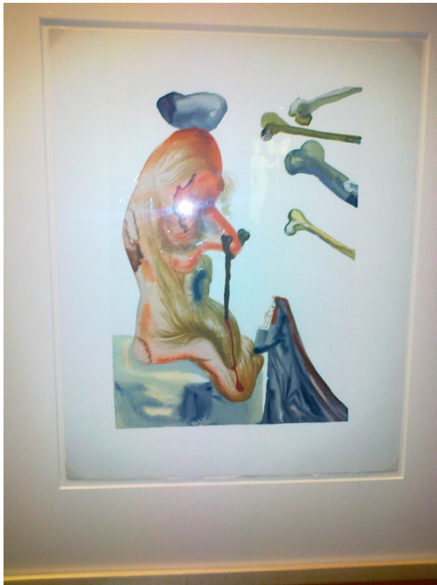
Обманщики. худ Сальвадор Дали . 18 мая 2017 год

И это всё? Опять утёрлись. 8 Нам показали Кто есть кто