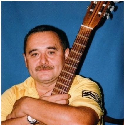
поэт-бард Камиль Булгари