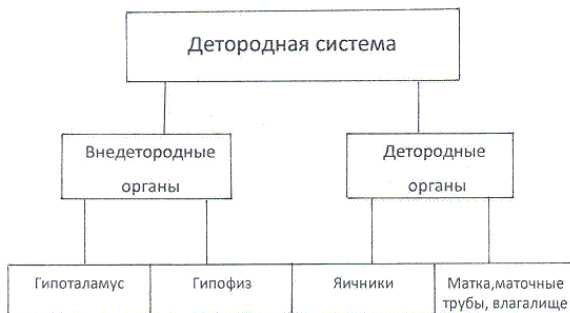
Рис. 2. Структурные элементы детородной системы