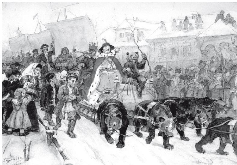
Большой маскарад в 1722 году на улицах Москвы с участием Петра I и князя-кесаря И. Ф. Ромодановского. Выполнено по описанию камер-юнкера Берхгольца. Художник В. И. Суриков. 1900 г.

«Никакое историческое художественное изложение не может дать столь верной идеи о тогдашнем времени, как простой безыскусственный, с тем вместе до мелочей отчетливый рассказ Берхгольца. Дневник его... превосходит все, что ни писали иноземцы о Петре Великом». (И. Н. Устрялов)