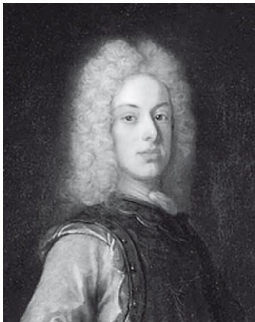
Портрет герцога Карла Фридриха Гольштейн-Готторпского. Художник Д. фон Крафт. 1722 г.

Карл Фридрих Гольштейн-Готторпский (1700–1739) – герцог Гольштейна из рода Готторпов, отец российского императора Петра III, племянник шведского короля Карла XII (сын его сестры Гедвиги Софии), зять Петра I и Екатерины I