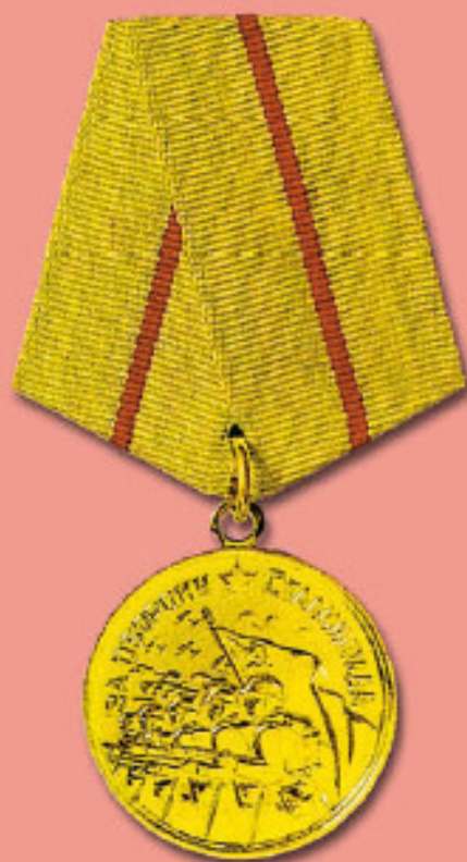
Медаль «За оборону Сталинграда»