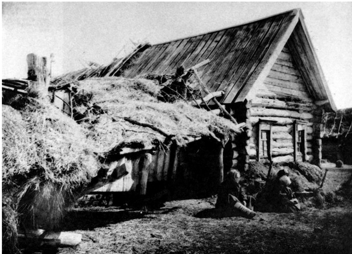
Крестьянский двор в голодающей Нижегородской крестьянской губернии. Документальная фотография. Осень 1891 года.

12 октября я буду в Нижнем и в тот же день, если найду Ваш адрес, выеду к Вам».