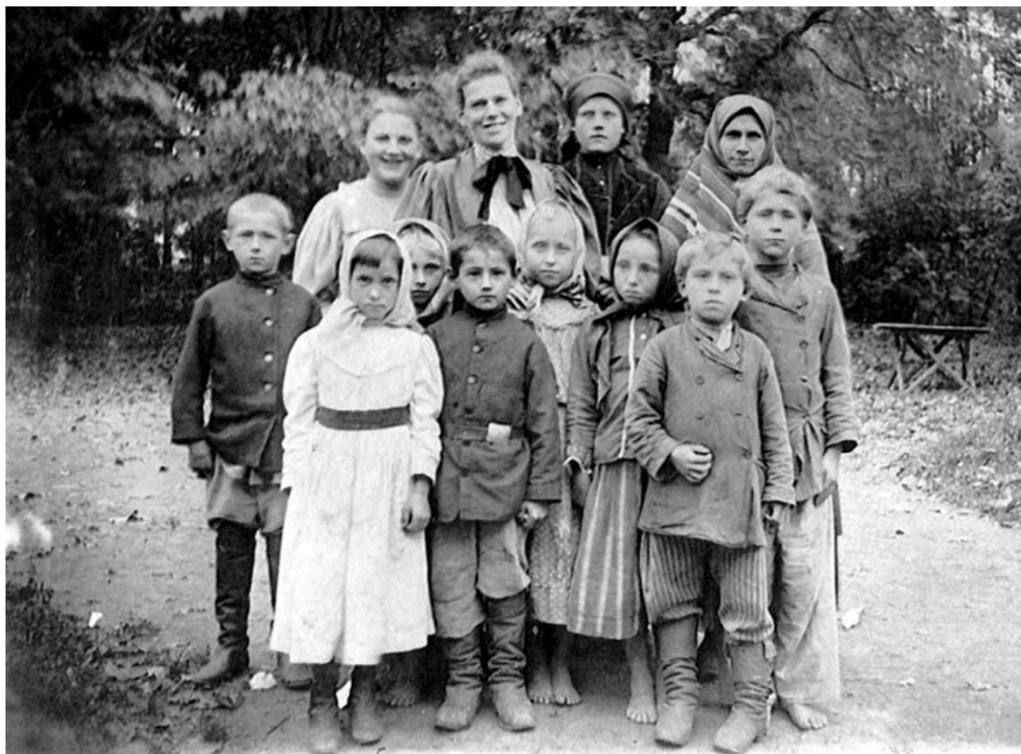
Дети начальных классов земской школы с учительницей. Эпоха Чехова. 90-е годы XIX столетия.

«А какой прекрасный народ в Нижегородской губернии. Мужики ядреные, коренники, молодец в молодца – с каждого можно купца Калашникова писать. И умный народ».