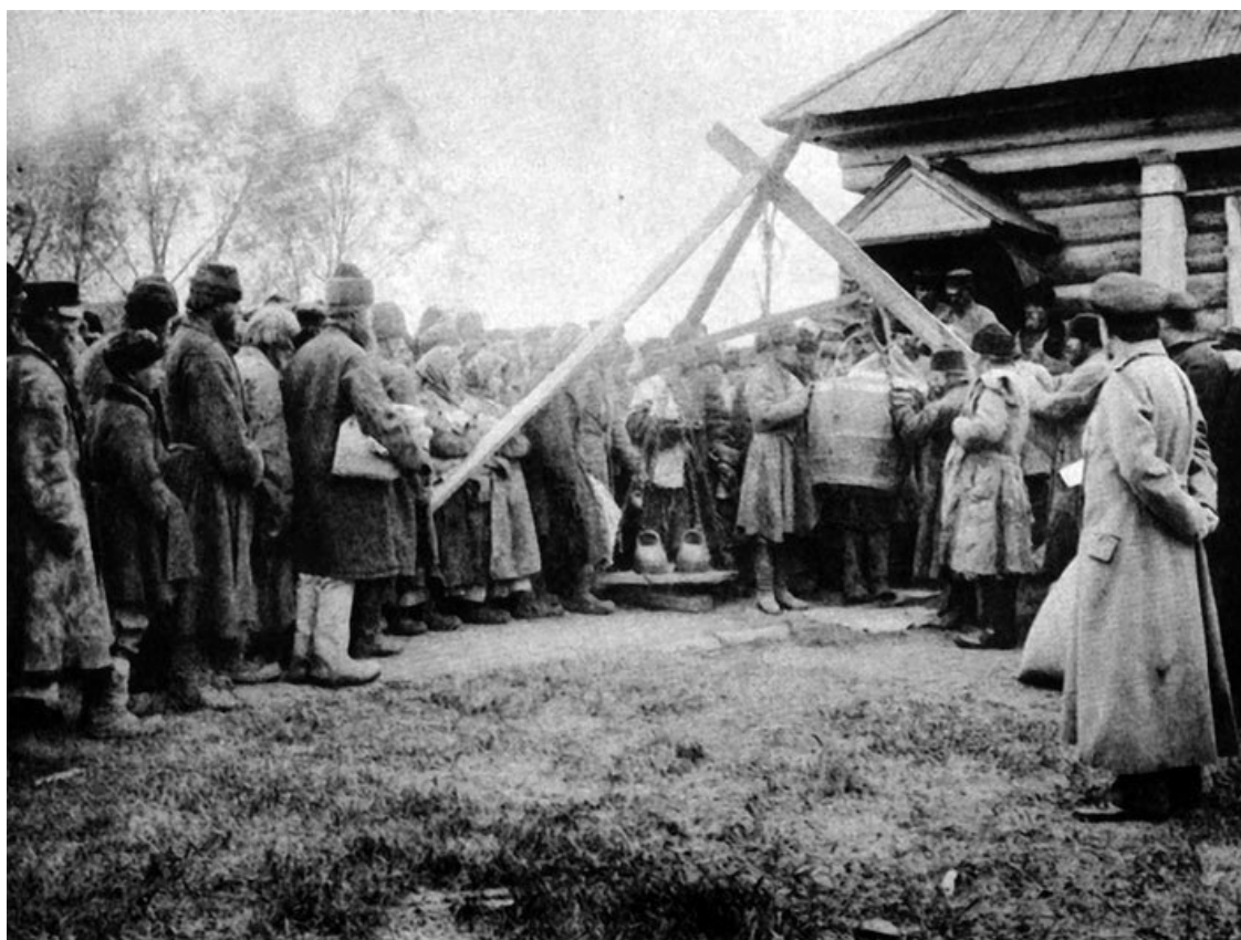
Крестьянский сход. Раздача помощи и субсидий. Нижегородская губерния, 1891 год.