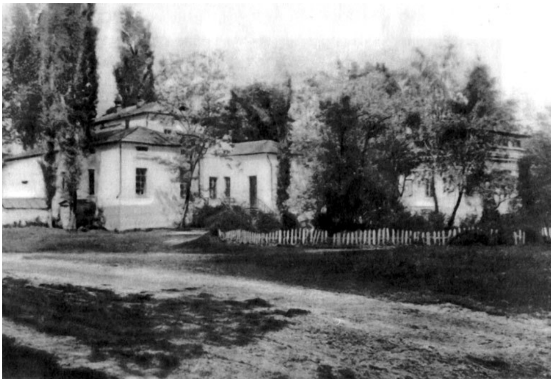
Имение Лука, в котором в 1888–1889 годах Чеховы жили в летние месяцы.