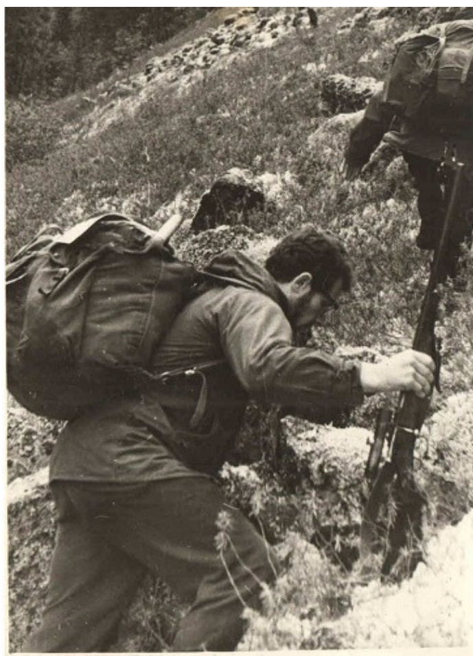
Лезу в гору я

Распивая очередную рюмочку «чая» и закусывая баночной тушенкой, местный начальник аэропорта, ехидно осведомившись о запасах оной, дает дельный совет: там, за речкой, «козлов» – умотаться, так же сидеть задаром, надо смотаться туда и добыть свежего мяса для всей честной компании. Сказано – сделано, и вот я на том берегу, переплыв на утлой лодчонке и снесенный метров на пятьдесят вниз по течению, сжимая в руках ТОЗ-17, начинаю храбро карабкаться по захламленной валежником лощинке вверх.