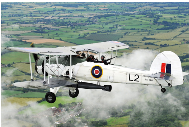
Восстановленный «Фейри» «Сурдфши» Mk. I в полете, Великобритания, 2012 год

Рубеж атаки авианосной группы установили на удалении в 315 км от базы противника.