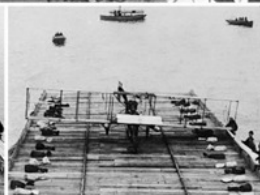
Посадка Эли на биплане «Кертис Голден Флаер» на платформу крейсера «Пенсильвания»