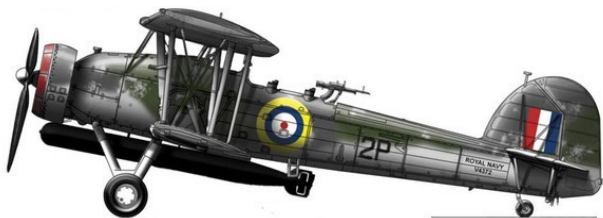
Торпедоносец «Фейри» «Суордфиш» Mk. I

Основной ударной силой авиагрупп «Игла» и «Илластриеса» были торпедоносцы «Фейри» «Суордфиш» Mk. I («Рыба-меч»). Трёхместный торпедоносец, принятый на вооружение палубной авиации королевского флота ещё в 1936 году, на подфюзеляжном узле нес одну 457-мм торпеду или морскую 680-кг мину, или подвесной топливный бак на 318 литров. На 4-х подкрыльевых узлах могли подвешиваться авиабомбы в 250 или 500 фунтов. Общий вес боевой нагрузки торпедоносца не мог превышать 730 кг.