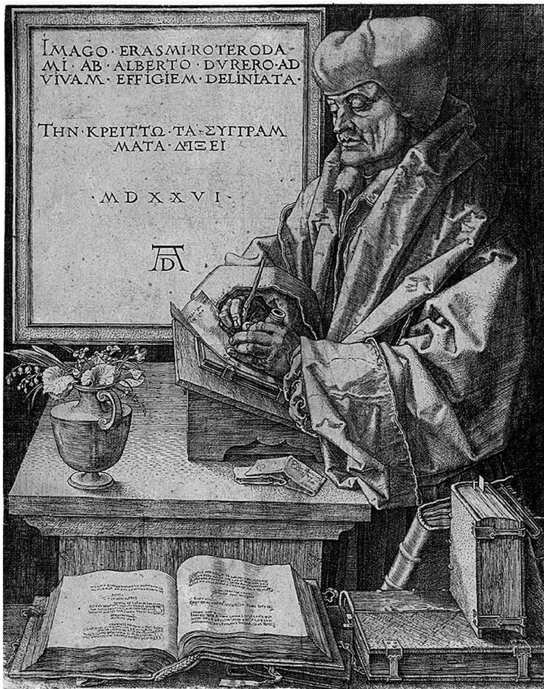
Портрет Дезидерия Эразма Роттердамского. Альбрехт Дюрер. Нюрнберг. Германия