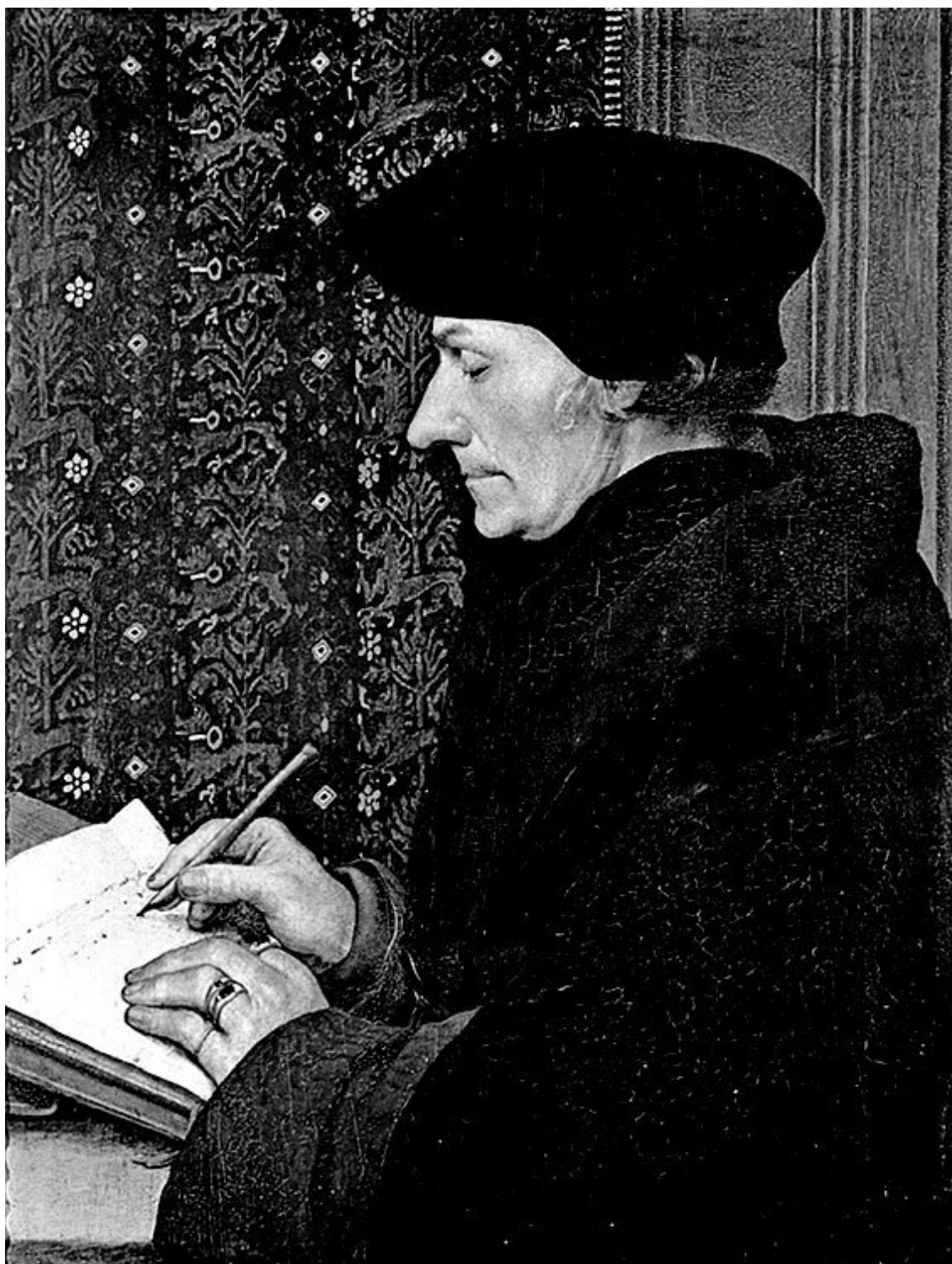
Портрет Эразма Роттердамского. Гольбейн, Ганс (Младший). Первая четверть XVI в. Люер