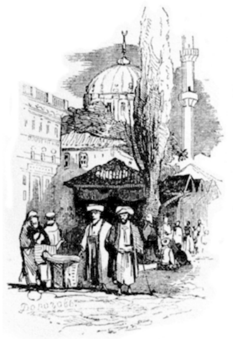
Виньетка: Фонтан в Константинополе, рис. Дорогов, рез. на дереве барон Клот.