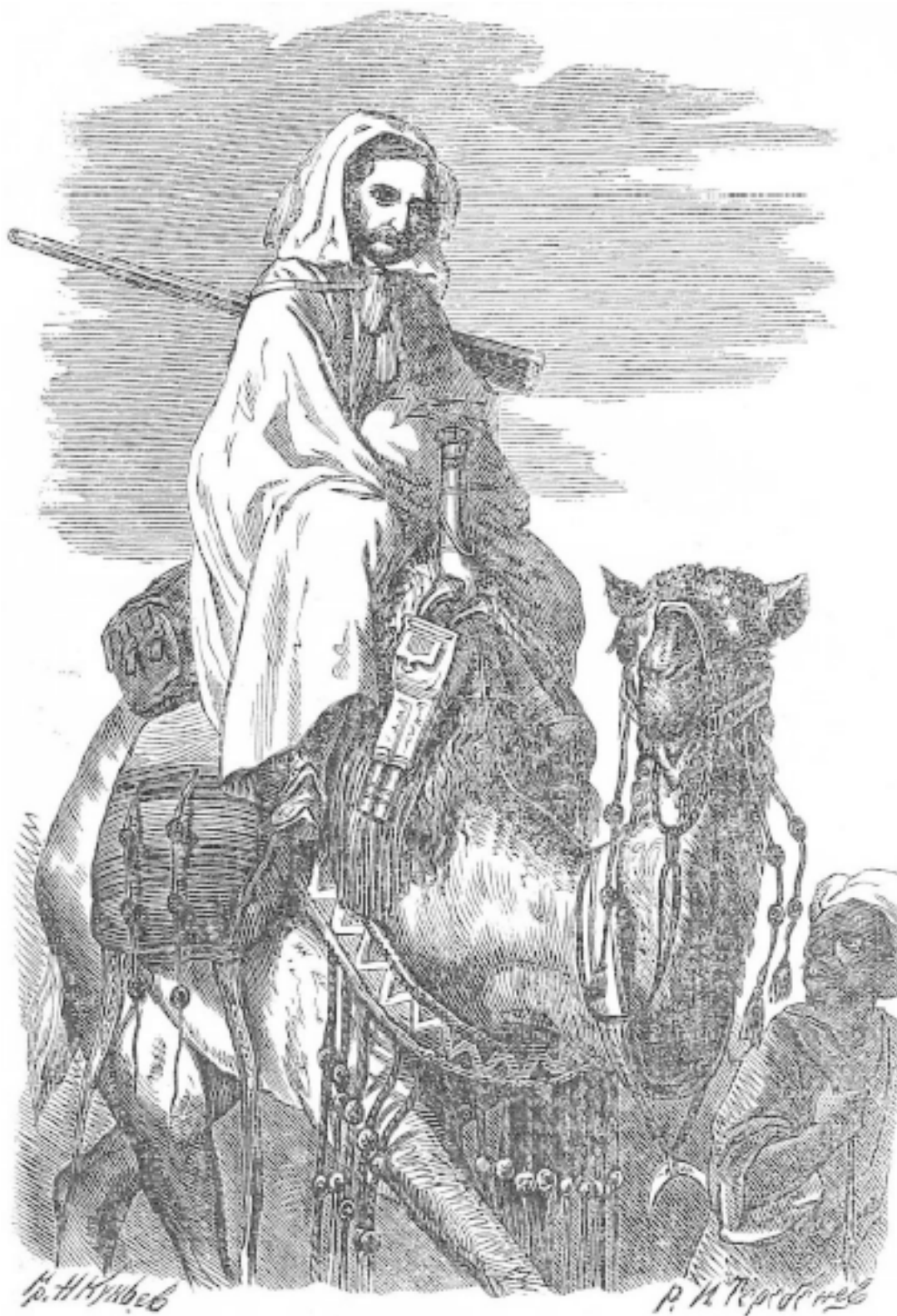
Е. П. Ковалевский.