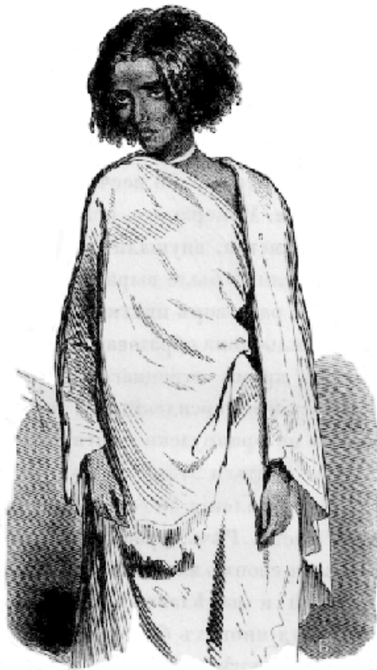
Абиссинянка, невольница, рис. Тим, рез. Бернадский.

Дом Камиль-паши расположен как и дворец, в котором мы жили в Александрии, как почти все дома богатых турков: – крестообразная зала и в каждом углу ее по комнате, где две; только комнаты отличались роскошью и даже вкусом убранства. Хозяин встретил меня. Это был тип тех турков чистой крови, если можно так выразиться, которые, по несчастью, нынче совсем переводятся. Манеры его, исполненные благородства, достоинства, внушали невольно к нему уважение; в лице было выражение кротости и покровительства; разговор цветист, вежлив, но без лести. Камиль-паша образован в восточном роде, то есть, кроме турецкого языка, знает прекрасно арабский и персидский, к тому же порядочно говорит по-французски, хотя еще нет года, как начал учиться этому языку. Он теперь пишет историю правления Мегемет-Али, по