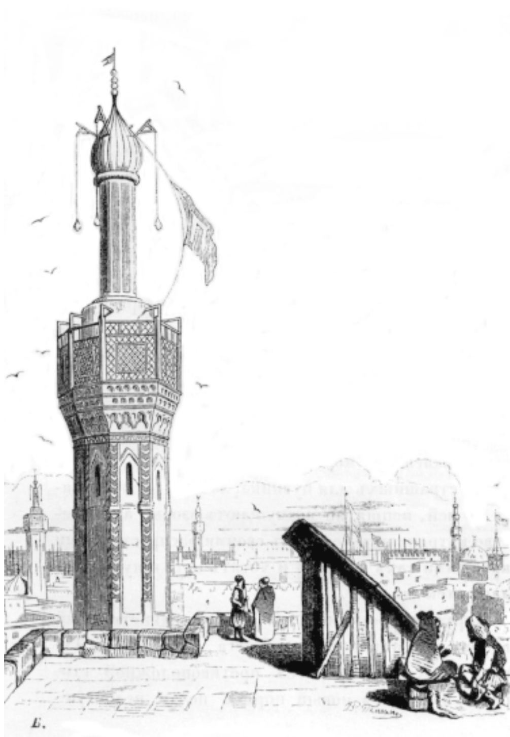
Вид Александрии (буква П), рис. Тим, рез. Бернардский.

Александрия не произвела на меня особенного впечатления. Вид пальм, чудно рисовавшихся на ярком горизонте, был для меня не нов: я приехал из Родосса; низменный, песчаный берег слишком обыкновенен для глаз, которые привыкли к нашим болотным берегам и даже иногда с любовью глядят на них; город же сам по себе имеет весьма приличный вид даже для запада, не только для востока. С старого порта, где остановился наш пароход, Александрия особенно хороша. Налево – дворец паши, гарем, сад, маяк; против нас прекрасное строение арсенала, красивые дома, крепость, еще сады; только с правой стороны песчаная коса, далеко