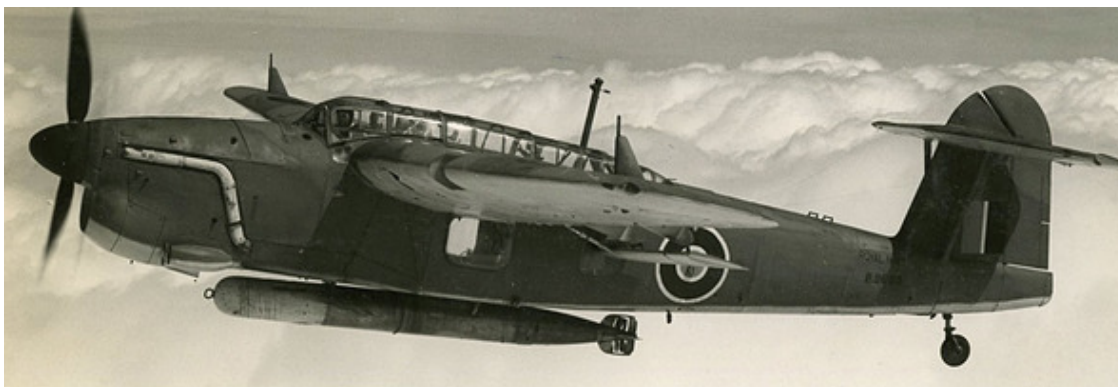
В полёте торпедоносец «Фейри» «Барракуда» ТВ Mk. I

Разработка нового палубного ударного самолёта для флота Её величества, призванного заменить устаревшие бипланы-торпедоносцы, была начата фирмой «Фейри» ещё в 1937 году. Однако англичане долго не могли согласовать окончательные требования к универсальному ударному самолёту, сочетающему в себе качества палубного торпедоносца, пикирующего бомбардировщика и разведчика.