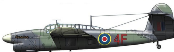
Торпедоносец-бомбардировщик «Фейри» «Барракуда» Мк. II

Самой массовой военной модификацией «Барракуды» стала ТВ Мк. II. первый полёт новой «Барракуды» состоялся уже в августе 1942 года. Самолёт, оснащённый более мощным 1640-сильным двигателем «Мерлин-32» и четырёхлопастным винтом, показал несколько лучшие лётные характеристики.