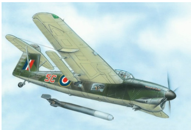
Торпедоносец «Барракуда» ТВ Мк. II в момент сброса торпеды

Вооружение всех «военных» модификаций было практически одинаковым. Для обороны задней полусферы стрелок-радист использовал спаренный 7.7-мм пулемёт «Виккерс». Основным вооружением торпедоносца была 457-мм (735-кг) авиационная торпеда, подвешиваемая под фюзеляжем. Вместо торпеды могли подвешиваться: одна 744-кг или 680-кг морская мина либо одна 726-кг броневой бомба либо одна-две 227-кг авиабомбы. Под крыльями на шести узлах подвески могли подвешиваться обычные или глубинные бомбы: две 227-кг или четыре 204-кг (глубинные) или шесть 113-кг, а также осветительные бомбы (16 шт.), гидроакустические буи (16 шт.) и плавучие дымовые шашки (4 шт.). Общий вес боевой нагрузки не превышал 816 кг.