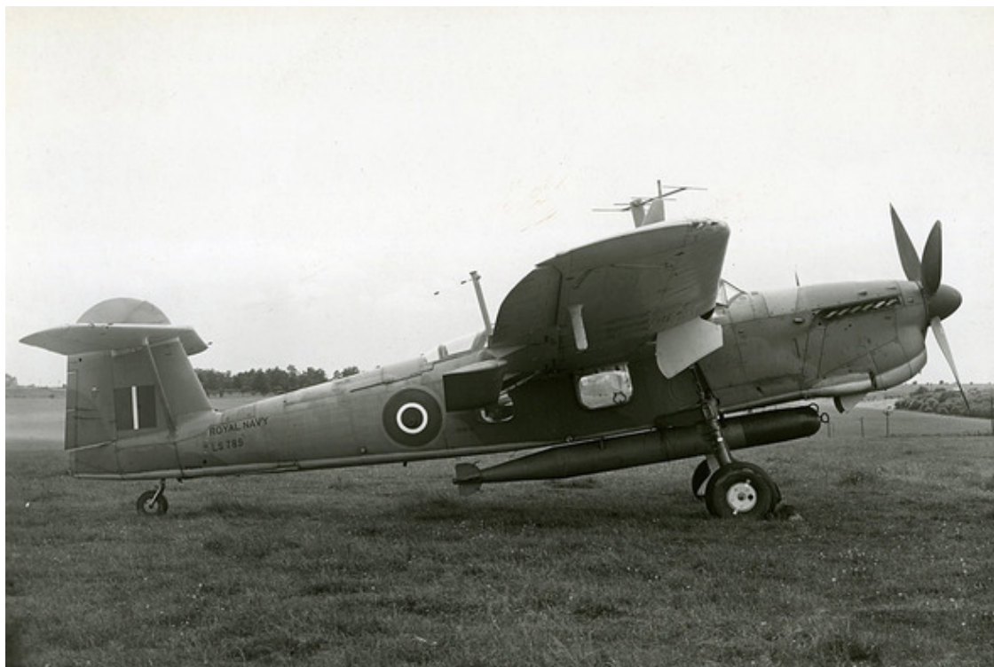
Торпедоносец «Фейри» «Барракуда» ТВ Мк. II на полевом аэродроме

Первой серийной моделью стала «Барракуда» ТВ Мк. I, совершившая свой первый полёт 18 мая 1942 года. На самолёте был установлен двигатель мощностью 1260 лошадиных сил. Сразу стало очевидно, что перетяжёлённому торпедоносцу такой мощности не хватает. Максимальная скорость «Барракуды» ТВ Мк. I на высоте 535 метров составляла 378 км в час, а крейсерская 311 км в час (и это без боевой нагрузки). Дальность полёта с нагрузкой составляла 845 км, а практический потолок 5608 метров (без подвесок).