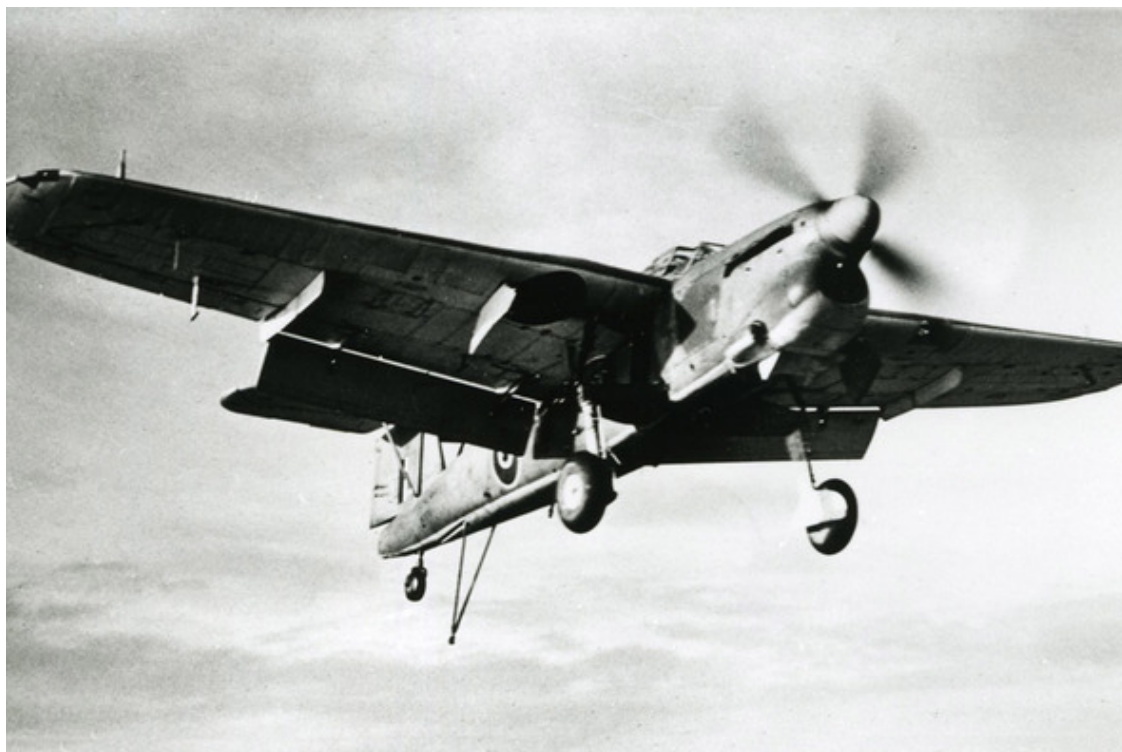
«Барракуда» ТВ Мк. II заходит на посадку (закрылки Янгмена и тормозной гак в соответствующем положении)

Самой массовой военной модификацией «Барракуды» стала ТВ Мк. II. первый полёт новой «Барракуды» состоялся уже в августе 1942 года. Самолёт, оснащённый более мощным 1640-сильным двигателем «Мерлин-32» и четырёхлопастным винтом, показал несколько лучшие лётные характеристики.