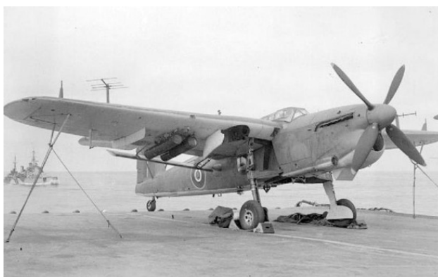
«Фейри» «Барракуда» Мк. II на борту авианосца «Индефатигейбл» со 113-кг глубинными бомбами под крылом, Тихий океан, 1945 год

Вооружение всех «военных» модификаций было практически одинаковым. Для обороны задней полусферы стрелок-радист использовал спаренный 7.7-мм пулемёт «Виккерс». Основным вооружением торпедоносца была 457-мм (735-кг) авиационная торпеда, подвешиваемая под фюзеляжем. Вместо торпеды могли подвешиваться: одна 744-кг или 680-кг морская мина либо одна 726-кг броневой бомба либо одна-две 227-кг авиабомбы. Под крыльями на шести узлах подвески могли подвешиваться обычные или глубинные бомбы: две 227-кг или четыре 204-кг (глубинные) или шесть 113-кг, а также осветительные бомбы (16 шт.), гидроакустические буи (16 шт.) и плавучие дымовые шашки (4 шт.). Общий вес боевой нагрузки не превышал 816 кг.