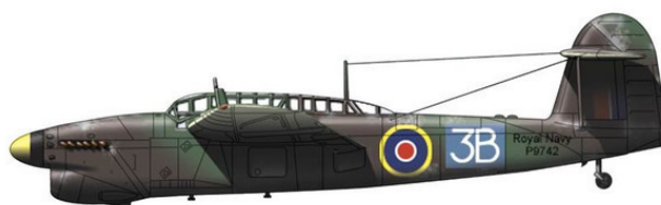
Торпедоносец-бомбардировщик «Фейри» «Barracuda» ТВ Мк. I

Первой серийной моделью стала «Барракуда» ТВ Мк. I, совершившая свой первый полёт 18 мая 1942 года. На самолёте был установлен двигатель мощностью 1260 лошадиных сил. Сразу стало очевидно, что перетяжёлённому торпедоносцу такой мощности не хватает. Максимальная скорость «Барракуды» ТВ Мк. I на высоте 535 метров составляла 378 км в час, а крейсерская 311 км в час (и это без боевой нагрузки). Дальность полёта с нагрузкой составляла 845 км, а практический потолок 5608 метров (без подвесок).