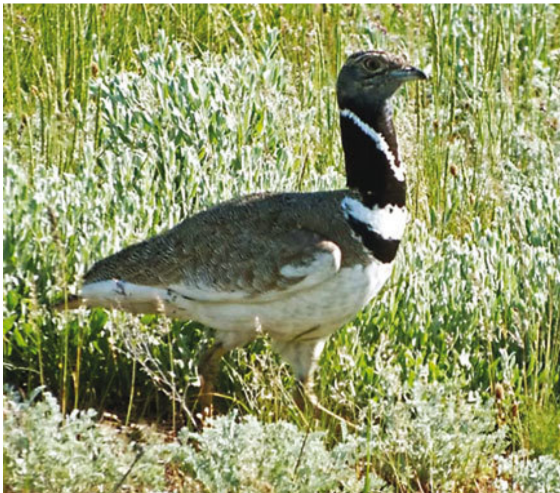
Исчезнувшие птицы Донецкой степи: а – дрофа, б – стрепет

Жители Старобельского района интересным природным уголком считают Казачий яр, который тянется от Евсуга, от Стинуватого леса, начинаясь за бугром недалеко от урочища Порохнины, мимо Антоновки, Орехово, Веселого, Раздольного и в Старобельске примыкает к долине реки Айдар. В детстве это место я заметил из автомашины, когда в группе школьников ехал на пионерский слет, из-за того, что в замеченной балке, сколько видит глаз, серебрятся заросли ковыля. То, что это место Казачьим ярком называется, я узнал, уже став взрослым, из Интернета. Летом после шестого класса, соблазнившись блеском ковыля, со своим другом Василем Колесником на велосипедах побывали там. Очень красиво оказалось и очень страшно – там какая-то впадина, и сразу попадаешь в глубину, в мертвую тишину, как в морскую пучину. Шаг ступил – стаю куропаток спугнул, второй шаг сделал – на зайца чуть не наступил, с перепугу чуть не умер. Пырей, тысячелистник, сокирки, ромашка и ковыль – выше колен; бабышник, жовтец, синец, шалфей, донник, петров батог, алтей – выше головы. Как выяснилось позже, напугались оба и больше не ездили туда. Отец рассказывал как-то, что подростком, будучи пастушком, он видел стаи дроф и стрепетов в степи и указывал рукою куда-то за бугор. Можно уверенно сказать: он имел в виду этот Казачий яр.