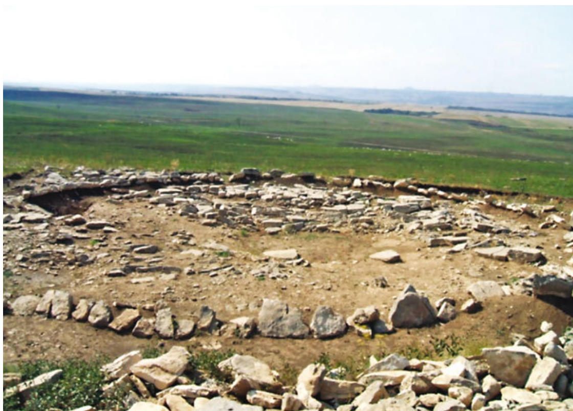
«Мергелева гряда»: «украинские доисторические пирамиды» (частично раскопанное состояние)

Интересным памятником старины являлись каменные бабы, которые когда-то маячили в Донецкой степи на многих курганах – стоянках древних людей. Но сейчас таких памятников в степи уже не найти, все растащили. Кто-то продавал их за границу, кто-то устанавливал у себя на подворье. Наверное, чудом каким-то энтузиастам удалось собрать в Луганском национальном университете имени Тараса Шевченко «Парк-музей антропоморфных стел и полочецких каменных изваяний» – музей под открытым небом, одно из крупнейших на постсоветском пространстве собрание языческих изваяний.