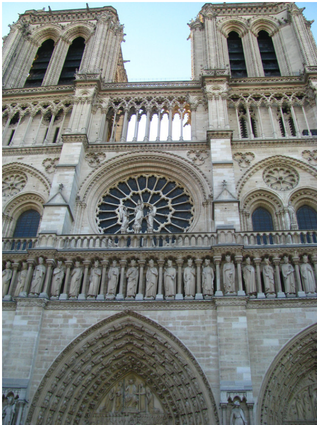
Notre-Dame de Paris – Собор Парижской Богоматери, Париж, август 2012 г.