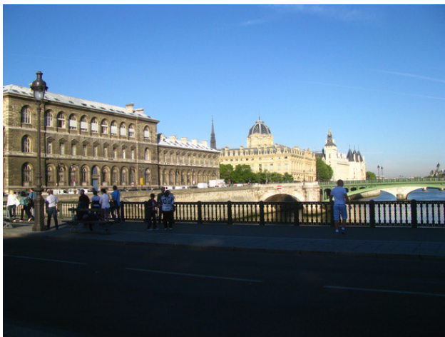
Париж. Вид с одного из мостов р. Сены