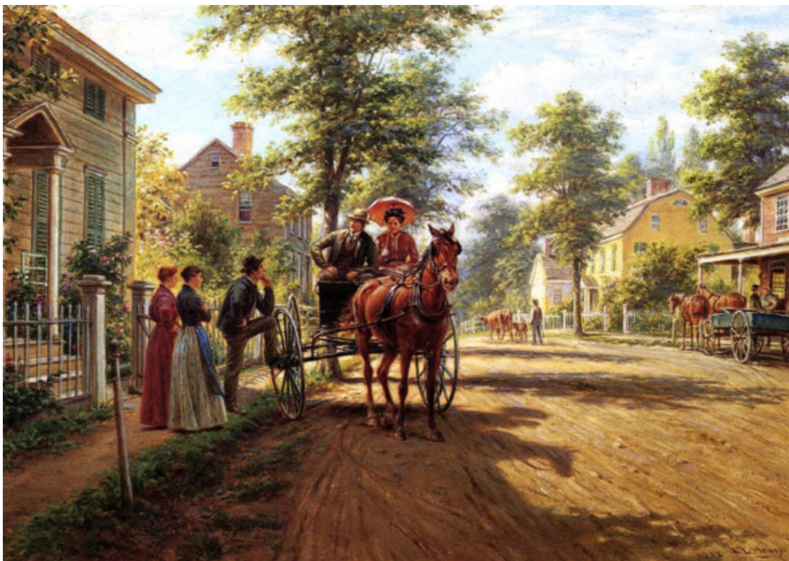
Эдвард Генри Лемсон, Однажды в воскресенье на деревенской улице, Америка, ~ 1860