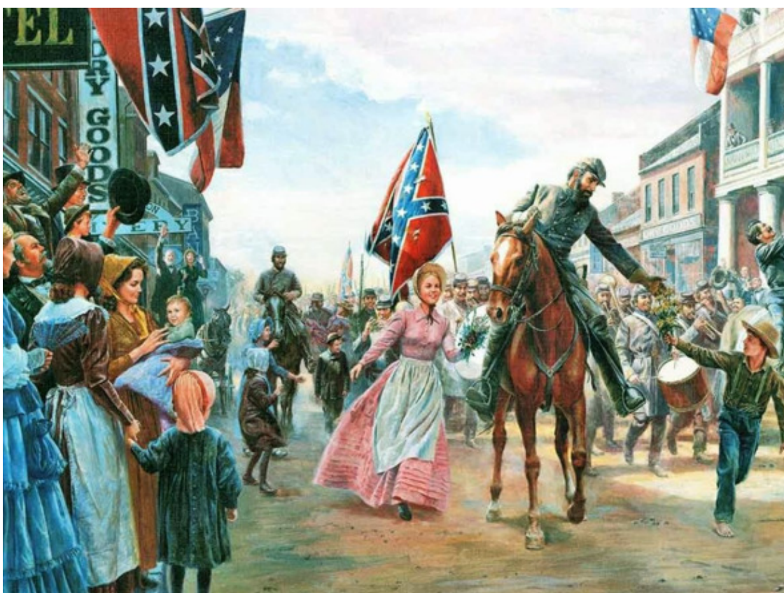
Неизвестный художник, Америка, 1861