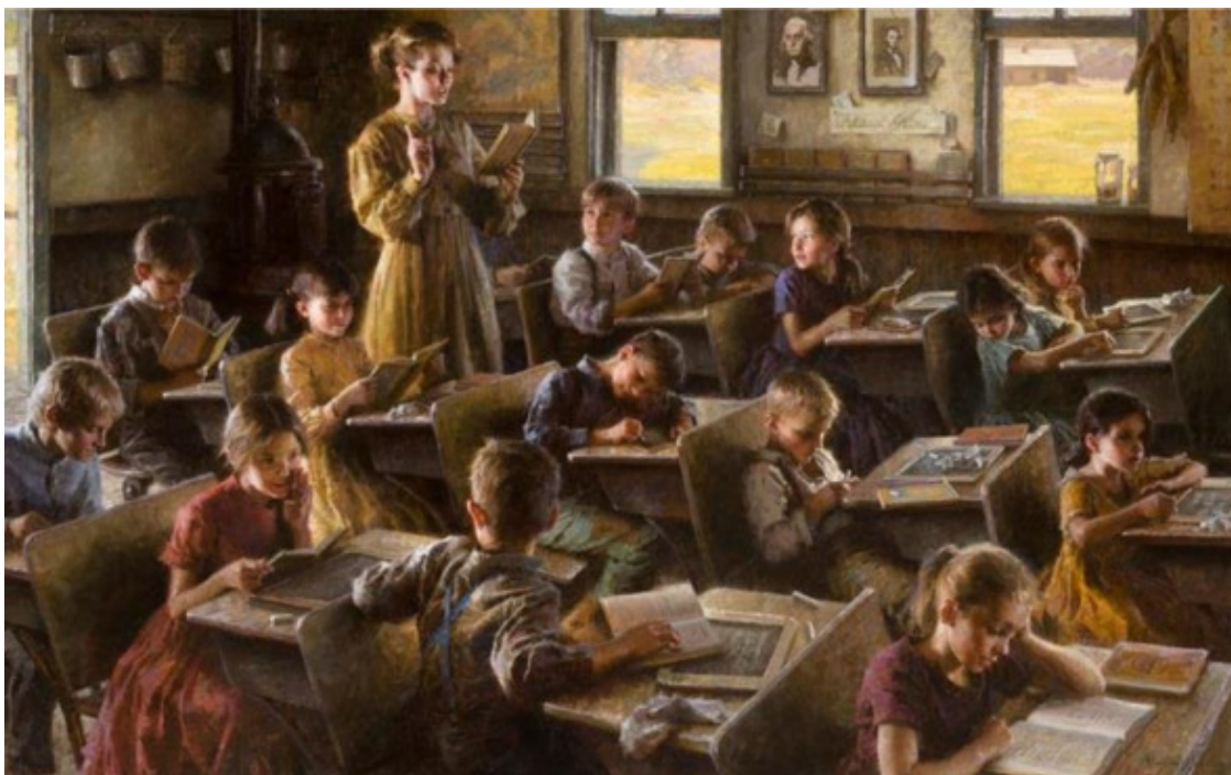
Морган Вестлинг, Сельская школа, Америка, 19 век

Сравнение рядом полотен известных художников хорошо отражает естественные истоки появления у населения понятия достоинства и основ общественного договора.