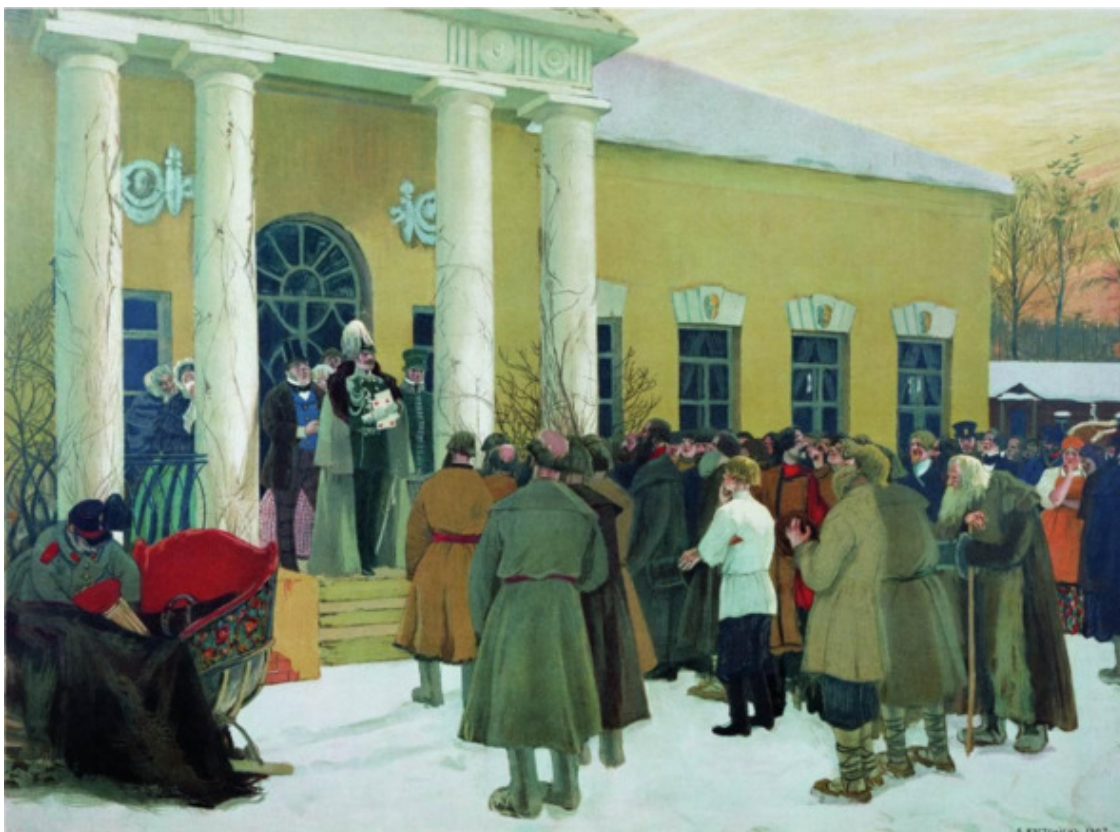
Кустодиев Борис Михайлович, Чтение манифеста, Россия, 1907

Манифест «О всемилостивейшем даровании крепостным людям прав состояния свободных сельских обывателей» для миллионов крестьян в России был зачитан в 1861 году.