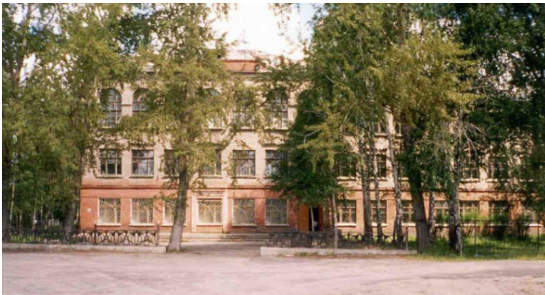
13 средняя школа в Гусь-Хрустальном

Первые впечатления о мире человека я получил не на уроках в классе, а от репродукций картин Третьяковской галереи, которыми были увешаны стены у входа в актовый зал нашей школы.