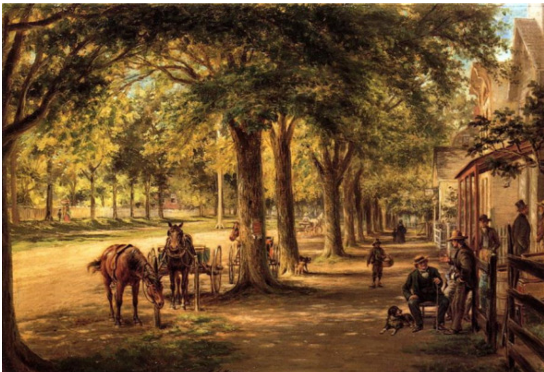
Эдвард Генри Лемсон, На сельской улице, Америка, ~ 1861