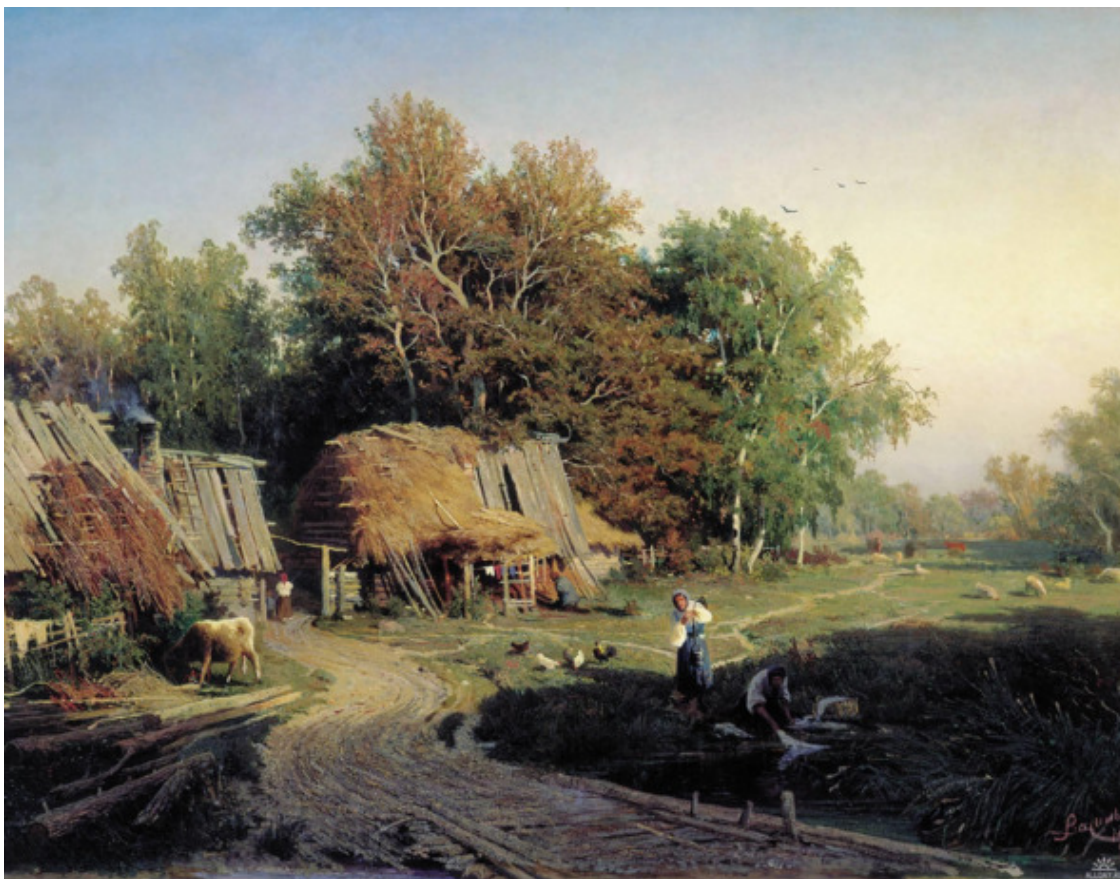
Фёдор Васильев, Деревня, Россия, ~ 1890