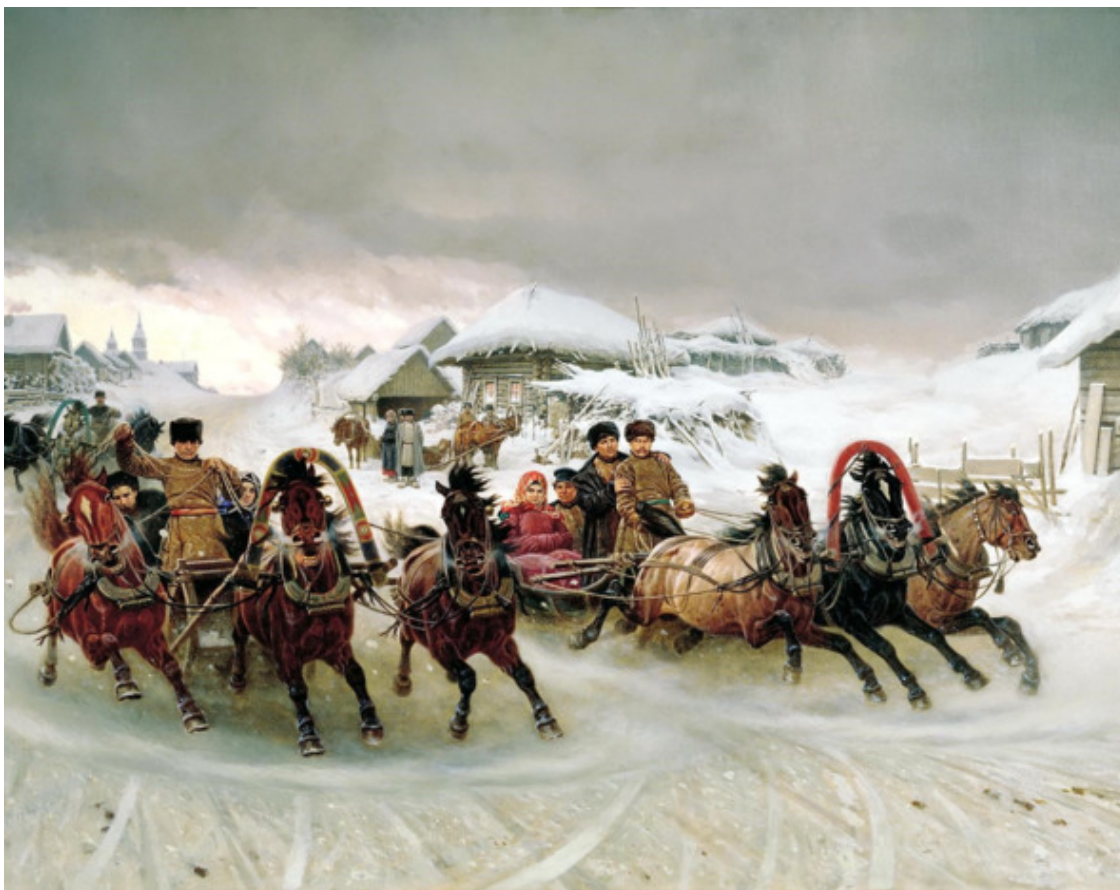
ГРУЗИНСКИЙ Пётр, Масленица, Россия, 1889