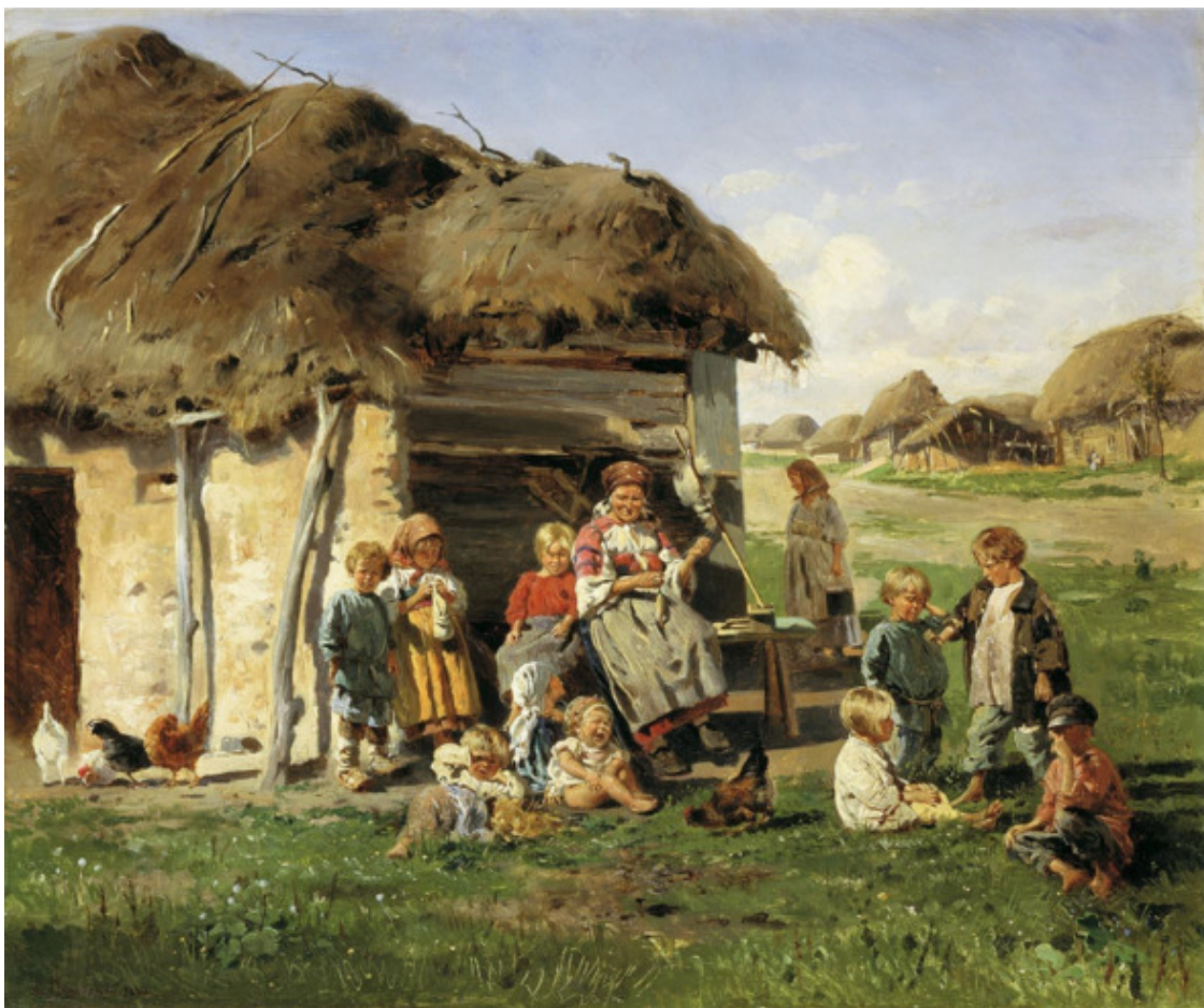
Маковский Владимир Егорович, Крестьянские дети, Россия, 1890