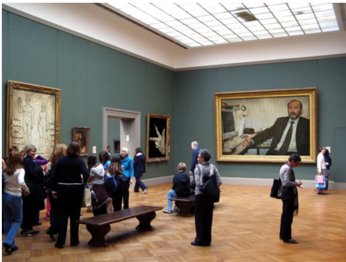
Мир Бориса Майорова, коллаж, Россия, 2007