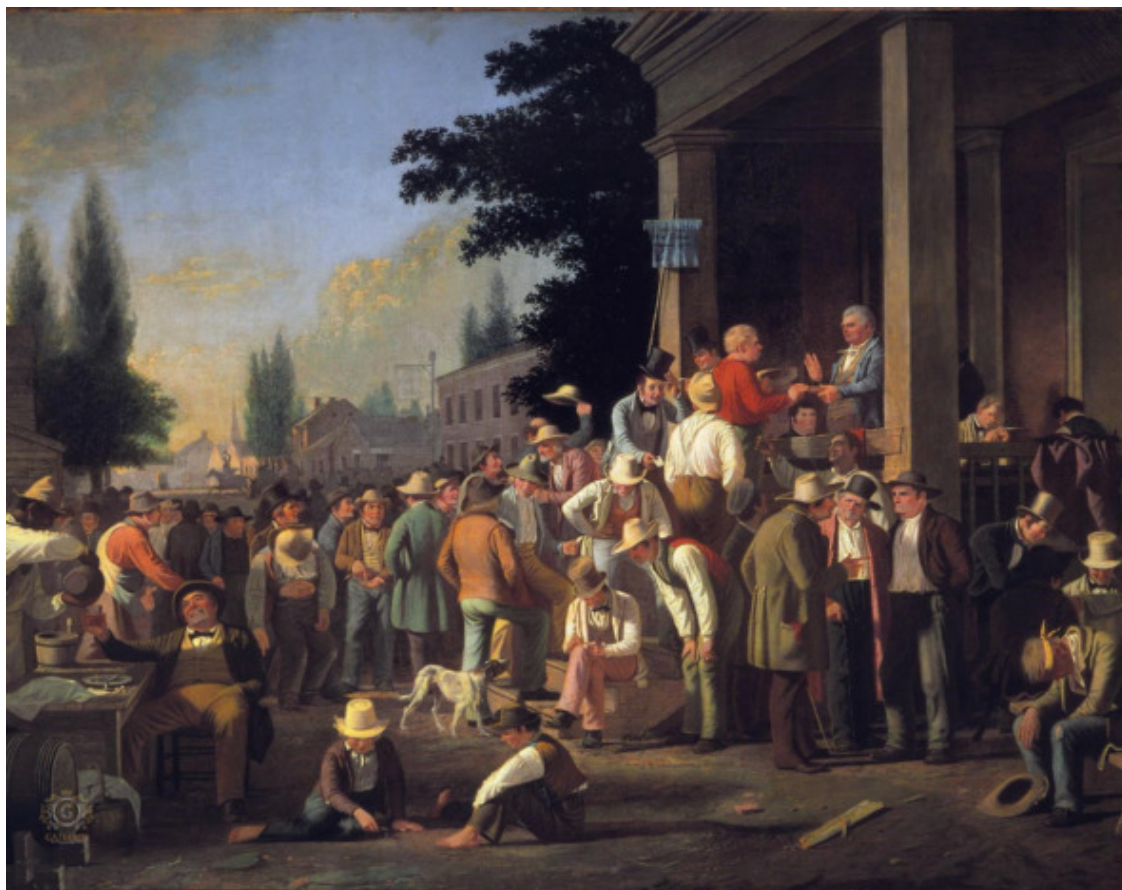
Джордж Калед Бингам, Окружные выборы, Америка, 1851

Первые выборы президента США состоялись в 1789 году, и победивший на них Джордж Вашингтон стал первым и последним президентом, получившим 100 процентов голосов выборщиков.