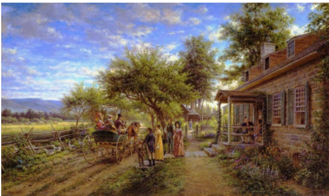
Эдвард Генри Лемсон, На сельской улице, Америка, ~ 1861