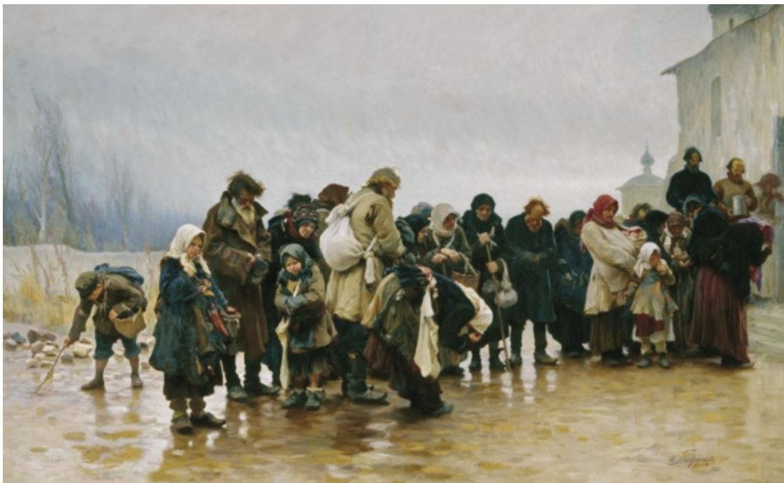
Иван Творожников, Нищие у церкви, Россия, 1889

Сравнение рядом полотен известных художников хорошо отражает естественные истоки появления у населения понятия достоинства и основ общественного договора.