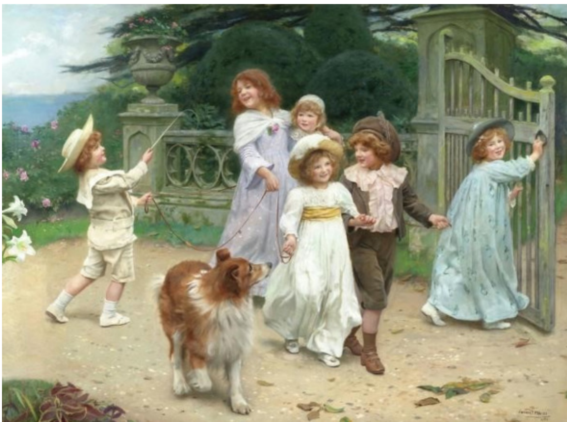
Артур Джон Эсли, Дети, Англия, ~ 1900