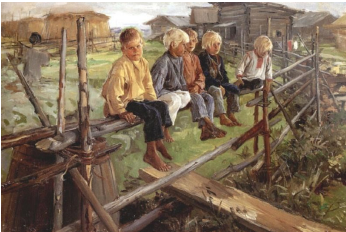
Илларион Михайлович Прянишников, Воробьи (дети на изгороди), Россия, 1889