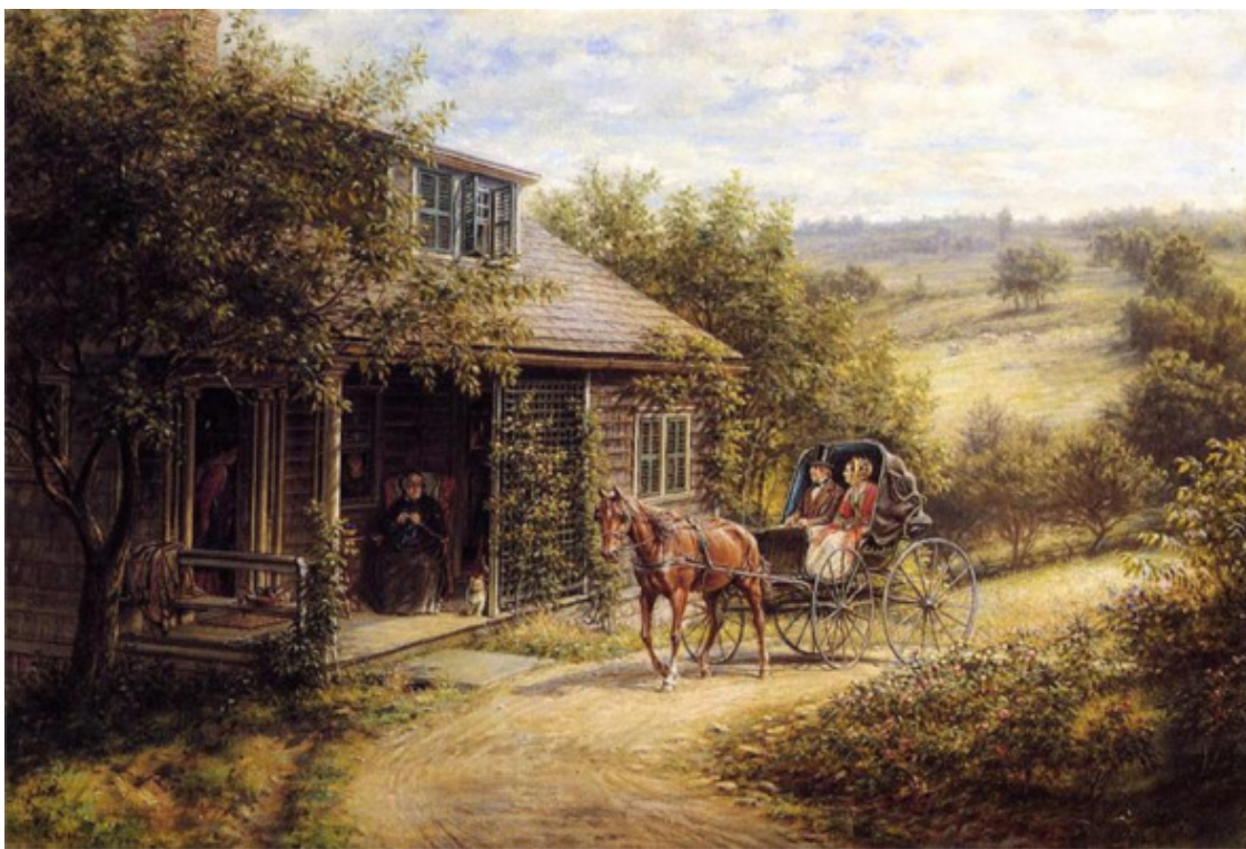
Эдвард Лемсон Генри, Нежданные гости, Америка, ~ 1890