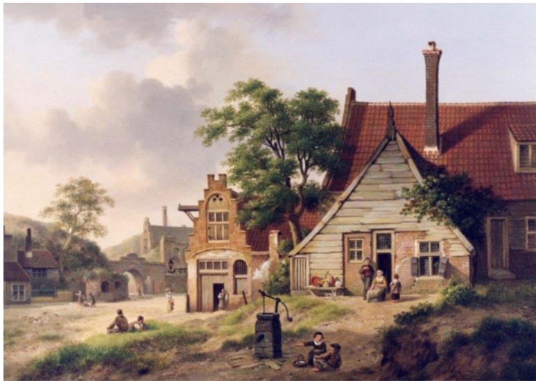
Верхейен, Ян Хендрик, Околица, Голландия, 1890