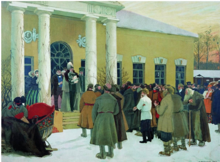
Кустодиев Борис Михайлович, Чтение манифеста, Россия, 1907

Манифест «О всемилостивейшем даровании крепостным людям прав состояния свободных сельских обывателей» для миллионов крестьян в России был зачитан в 1861 году.