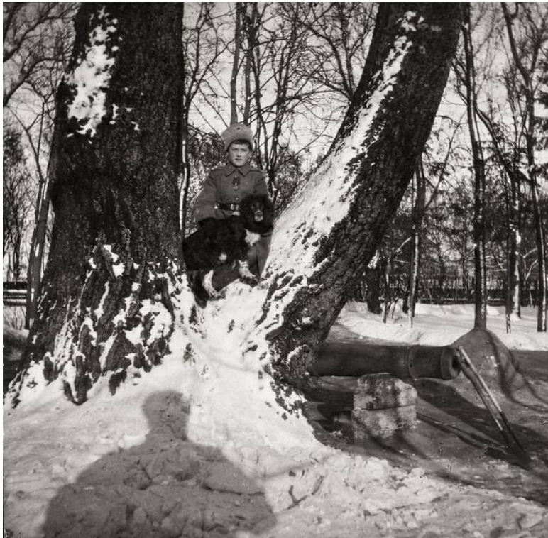
Тень Пьера Жильяра и царевич Алексей со своей собакой по кличке Джой в Царскосельском парке. Март 1917 г.