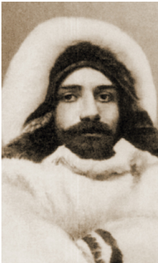
А. В. Колчак во время первой зимовки на полуострове Таймыр, 1900–1901 гг.