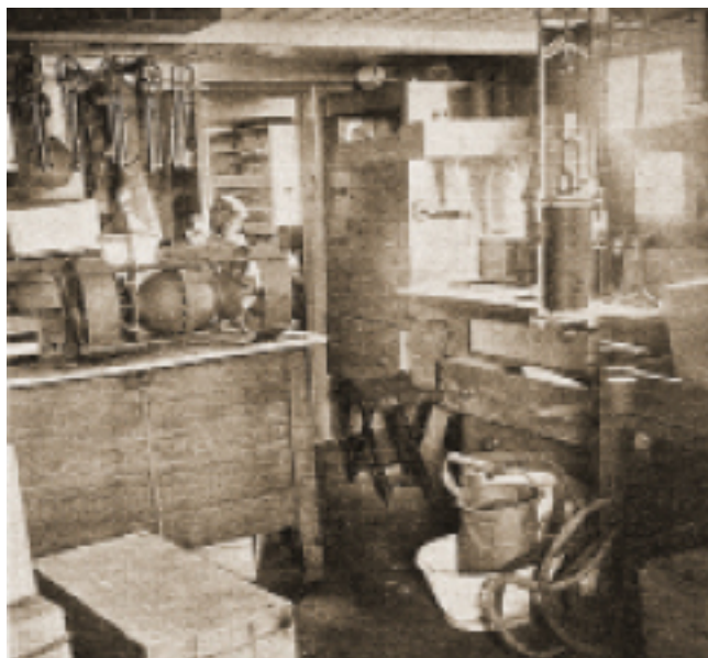
Гидрологическая лаборатория на яхте «Заря»

Срочное выполнение изложенного плана, по мнению Толля, являлось «во многих отношениях прямой потребностью». Он подчеркивал, что результаты новой полярной экспедиции имели бы большое значение для национальных интересов России. Помимо ответа на вопрос о существовании гипотетической «Земли Санникова», исследовании природы Новосибирских островов и прилегающего к ним района, предполагалось положить начало плаваниям пароходов из Карского моря в Лену и другие реки северо-востока Азии, вплоть до Берингова пролива, открыть новые районы морского промысла у северо-восточного побережья Сибири. Экспедиция должна была помочь предотвратить экспансию иностранцев на северо-восток Сибири и способствовать разрешению вопроса о сквозном плавании по Северному морскому пути.