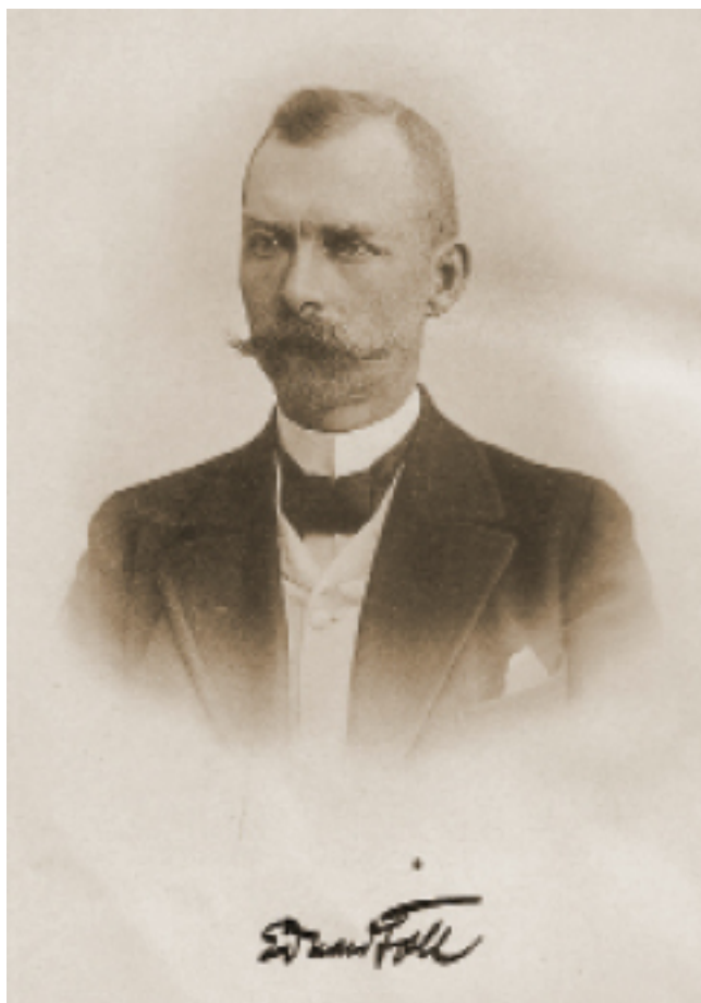
Барон Эдуард Васильевич Толль (1858–1902)

Выпускник Дерптского университета, естествоиспытатель Эдуард Васильевич Толль (1858–1902) впервые попал в Арктику в составе экспедиции доктора А. А. Бунге на Новосибирские острова (1885–1886 гг.).