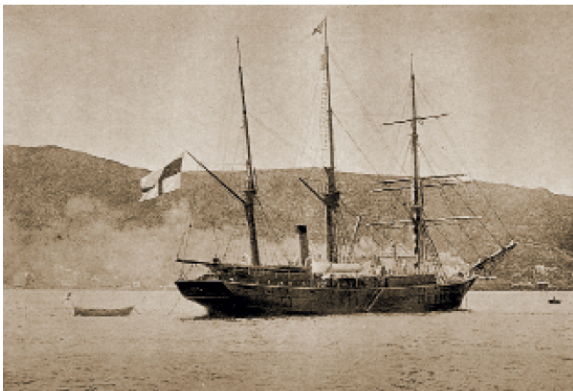
Яхта «Заря» в Норвегии, 1899 г.