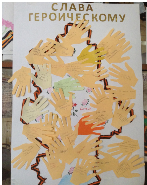
Рис.2 – Пожелания студентов и преподавателей жителям Донбасса в рамках проведения психологической акции «Скажи жизни „Да!“»

ющим образом: «8 сентября 1943 года Донецк был освобожден от немецко-фашистских оккупантов. Донбасс в своей истории уже проживал тот период, который мы проживаем сейчас. Что бы вам хотелось пожелать жителям Донбасса сегодня?»