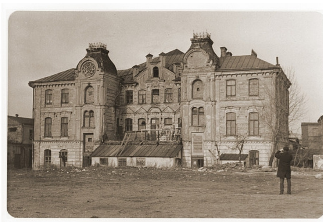
Фото из источника в списке литературы [11]

На месте уничтоженной огнем синагоги была построена синагога новая, возведение которой было разрешено королем Сигизмундом Третьим. Этой синагоге суждено было простоять дольше, но и она сгорела в пожаре 1889-го года (или по другим сведениям – в 1885-м году).