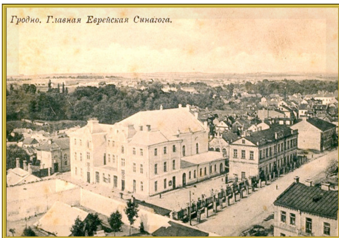
Фото из источника в списке литературы [13]

Большая Хоральная синагога Гродно в начале 20-го столетия