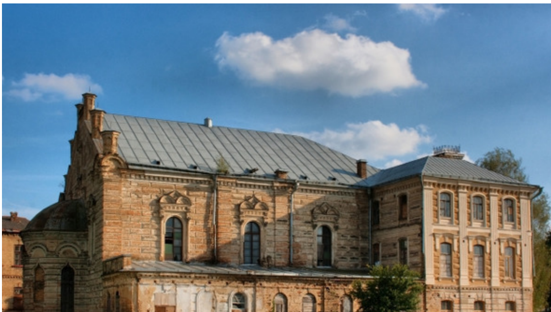
Фото из источника в списке литературы [11]

Больше всего при этом пострадавшими стали жилые дома (сотни), синагоги (полдюжины) и приют для еврейских детей-сирот. В июле 1900-го года огненная беда явилась вновь, уничтожив сотни жилых домов и дюжину синагог.