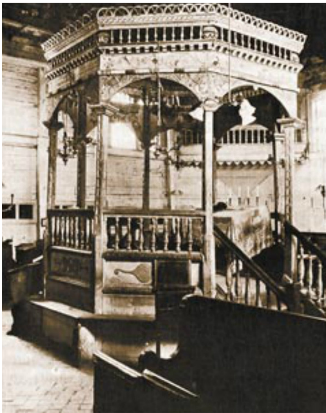
Бима деревянной синагоги в Гродно..