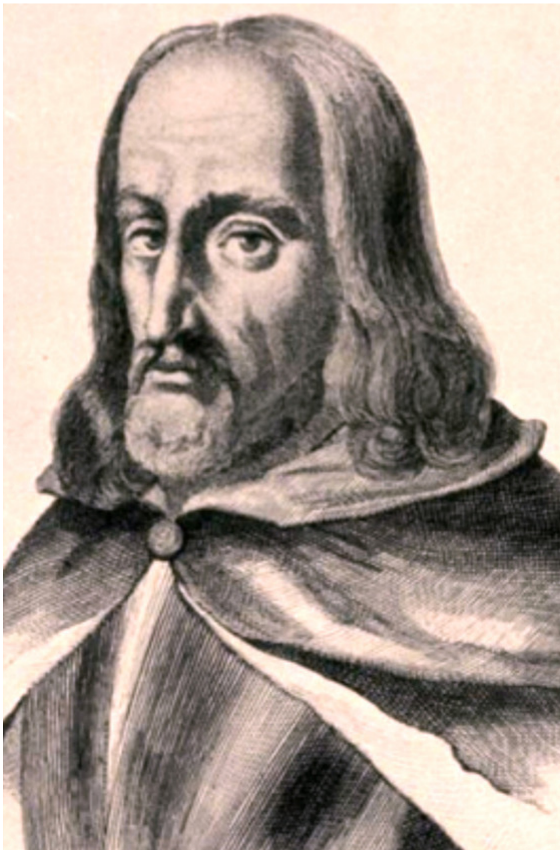
Санти Гуччи.

Здание данной синагоги было деревянным, поэтому когда в 1617-м году случился пожар, оно оказалось полностью уничтоженным.