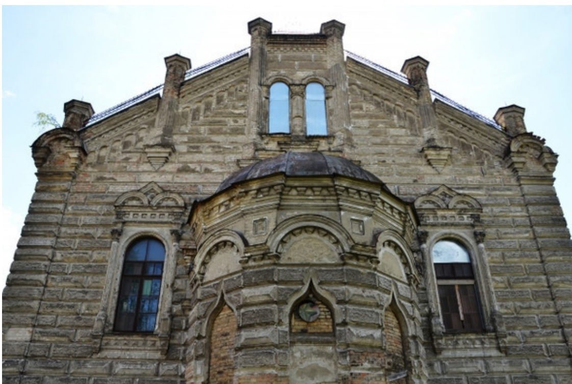
Фото из источника в списке литературы [11]

Больше всего при этом пострадавшими стали жилые дома (сотни), синагоги (полдюжины) и приют для еврейских детей-сирот. В июле 1900-го года огненная беда явилась вновь, уничтожив сотни жилых домов и дюжину синагог.