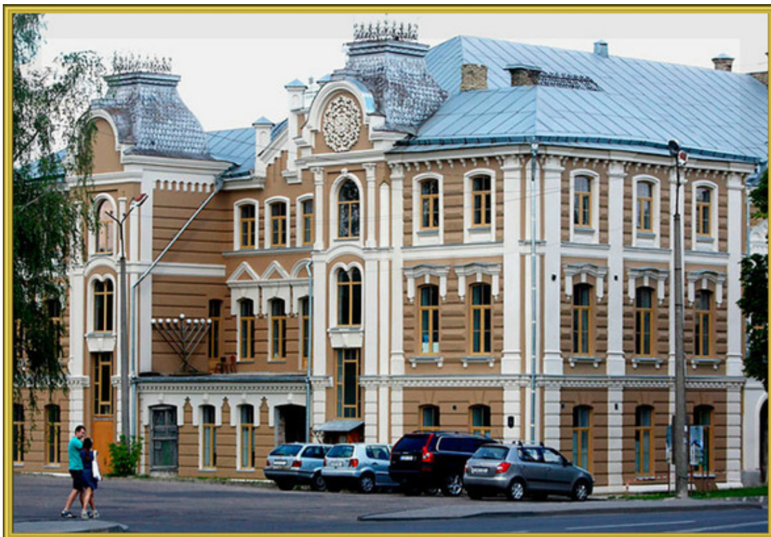
Фото из источника в списке литературы [3]