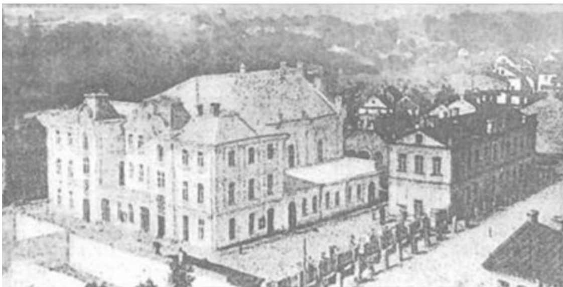
Фото из источника в списке литературы [16]