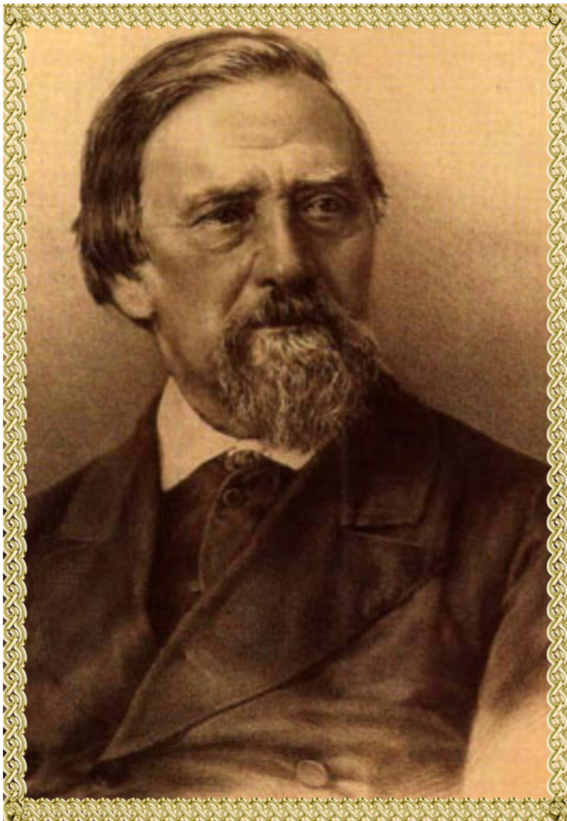
Наполеон Орда. Фото из источника в списке литературы [7]