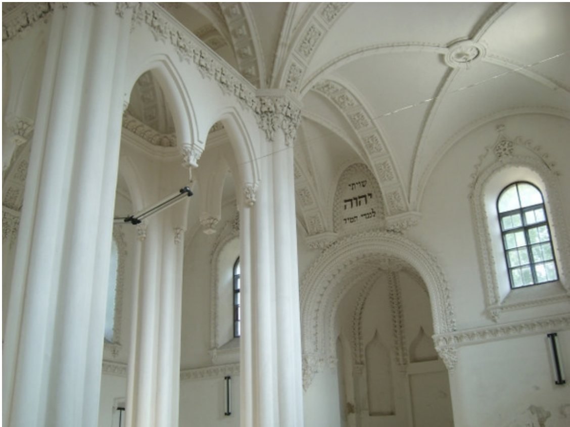
Фото из источника в списке литературы [11]

В конце 19-го столетия синагог в Гродно было тридцать, а еврейского его населения в 1906-м году насчитывалось свыше двадцати пяти тысяч человек, что количественно превышало половину общей численности населения города.