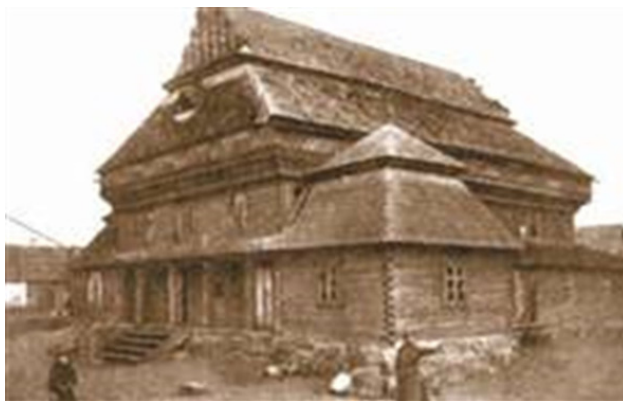
Фото деревянной синагоги Гродно, разрушенной в конце первой мировой.. Фото из источника в списке литературы [2]