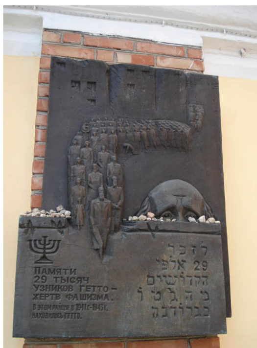
Фото из источника в списке литературы [17]