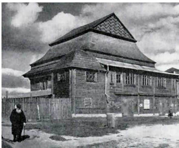
Средневековая синагога (здание не сохранилось).

Первоначально она была выполнена из такого распространенного в стародавние времена материала как дерево. Как она в точности выглядела – сказать проблематично. Можно лишь ориентироваться на виды некоторых из деревянных синагог, рисунки или фото которых сохранились.