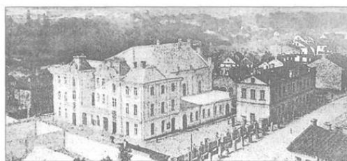
Большая синагога в Гродно. Фото нач. XX в.

Интересной представляется часть синагоги, являвшаяся главным фасадом, а также архитектура примыкающих к ней боковых зданий. Крыша синагоги была сильно понижена, имело место преобразование ее боковых объемов с помощью украшения их изящными, выполненными в псевдорусском стиле башенками, а также добавления большого количества лепнины. В итоге декор синагоги (как внешний, так и внутренний) стал поистине роскошным.