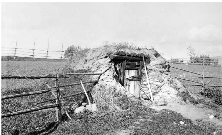
Сауна по-черному, в землянке

То, что финской сауне свойственен сухой жар, – миф. И миф, надо сказать, небезопасный для здоровья. Причем настолько въедливый, что перекопал даже в некоторые словари и справочники современности.