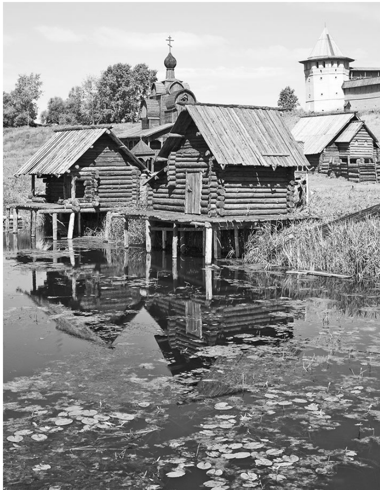
Баня на сваях