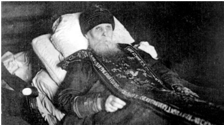
Преподобный Серафим Вырицкий. Около 1944 г.

«Бедный, бедный Петербург!.. – просто сказал он после двух-трех моих слов о зиме 41/42 годов. – Мученики... да-да, это мученики...»