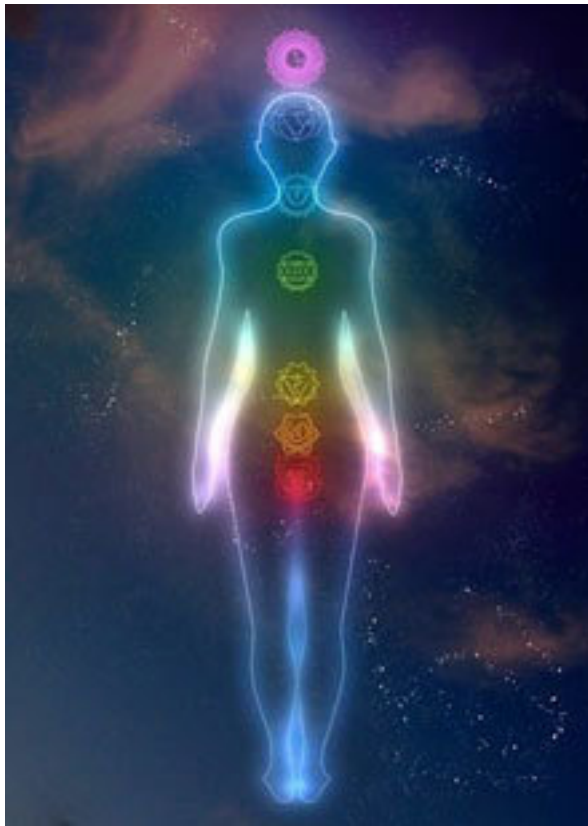
Рис. 4. Чакры

В этой настройке мы объединяем себя в единое целое, на разных частотах прорабатывая тело и сознание. Каждая чакра – это связь с каким-то тонким телом, а также фиксация