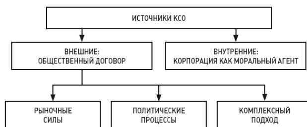
Рис. 1. Основные трактовки источников КСО

Основные различия в трактовках адептов общественного договора были связаны с типологией тех внешних сил, которые диктуют корпорации и менеджерам соответствующие обязанности. Можно выделить три группы исследований, соотносящих это внешнее воздействие с рыночными силами, с политическими процессами, а также придерживающихся комплексного подхода (рис. 1).