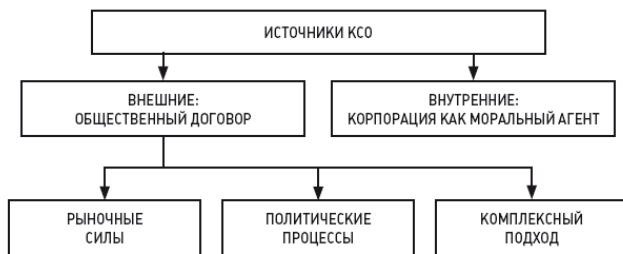
Рис. 1. Основные трактовки источников КСО

обязанности. Можно выделить три группы исследований, соотносящих это внешнее воздействие с рыночными силами, с политическими процессами, а также придерживающихся комплексного подхода (рис. 1).