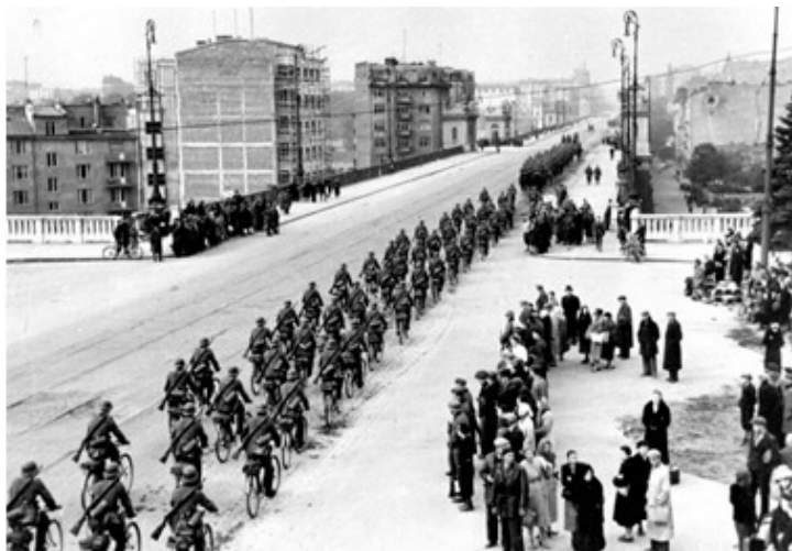
Немецкие войска вступают в Варшаву.

9 сентября немцы официально заявили, что взяли Варшаву и Нарком иностранных дел В. М. Молотов направил германскому послу В. фон Шуленбургу поздравительную телеграмму по случаю вступления немецких войск в Варшаву. Однако поздравление оказалось преждевременным – Варшава сражалась еще до 27 сентября 1939 г.