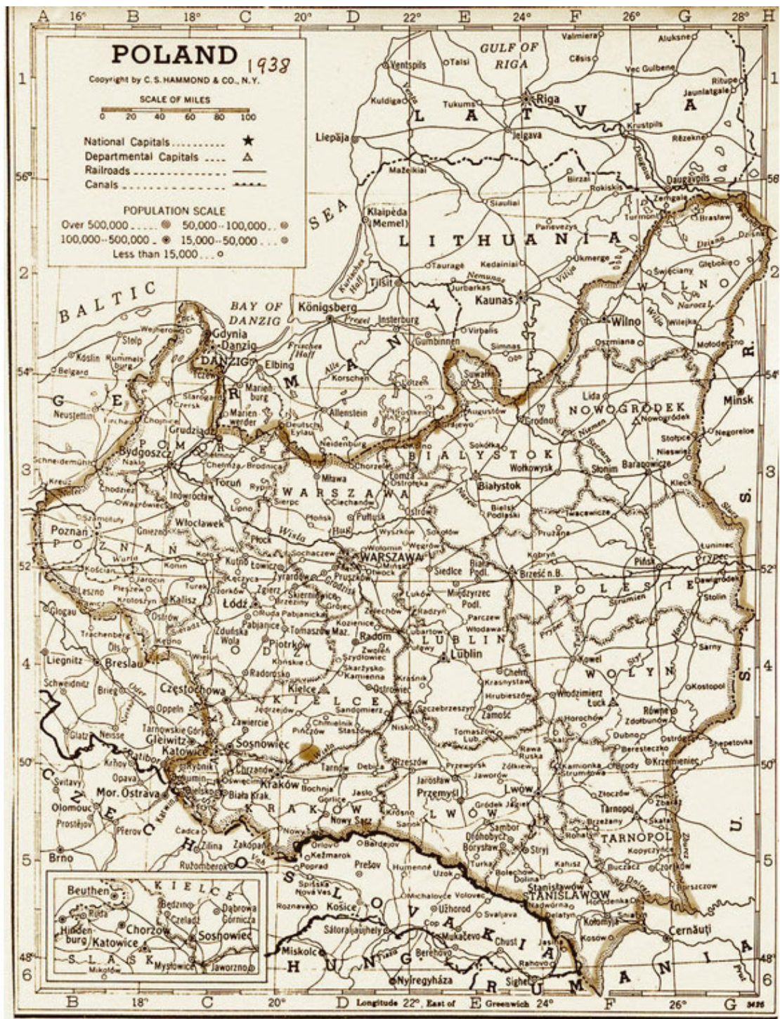
Карта Польши. 1938 г.

31 августа 1939 г. договор был ратифицирован Верховным Советом СССР, а 1 сентября 1939 г. в 4.45 германские войска без объявления войны перешли границу Польши, начав II мировую войну.