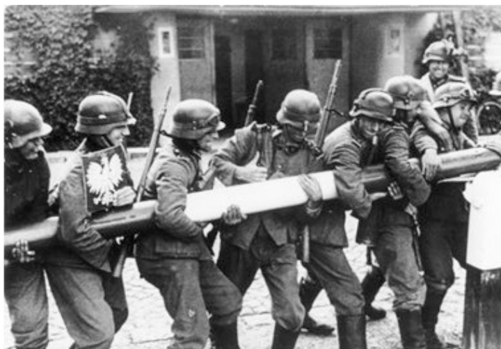
Немецкие солдаты ломают шлагбаум на границе с Польшей.

В 11.00 советник германского посольства в СССР Г. Хильгер прибыл в Народный комиссариат иностранных дел (НКВД) СССР, где сообщил о начале войны Германии с Польшей и о присоединении к Германии Данцига, а также передал просьбу начальника Генерального штаба Военно-воздушных сил Германии, чтобы радиостанция, располагавшаяся в столице БССР Минске, в свободное от передач время передавала для «срочных воздухоплавательных опытов» непрерывный сигнал с вкрапленными в него позывными «Рихард Вильгельм 1.0», а во время передач, чтобы как можно чаще в эфире звучало слово «Минск» для использования этой радиостанции немецкими летчиками в качестве радиомаяка во время налетов на Польшу. Но советская сторона согласилась лишь повторять слово «Минск».