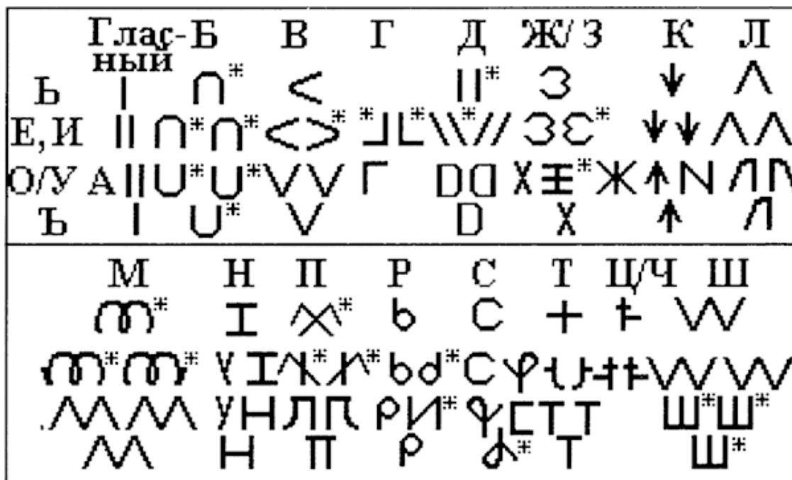
Рис. 3. Предварительная слоговая азбука – руница

Я думаю, рунице помогли умереть те же Романовы, потому что это была письменность, которая несла в себе тайное знание. Знаете, что такое гадание на черепаховом панцире? А как гадать по палочкам, раскидывая их? Если уметь читать руницу и лигатуры, составленные из знаков руницы, любое гадание легко даётся. Даже одного взгляда на встречное дерево, на расположение ветвей на нём, на трещины на земле или льду достаточно, чтобы прочесть предназначенное вам послание и увидеть предполагаемое будущее. Предки создавали руницу, глядя на природу и на знаки, которые она подавала. Они были тогда едины с Природой, поэтому легко создали полностью прикладной алфавит.