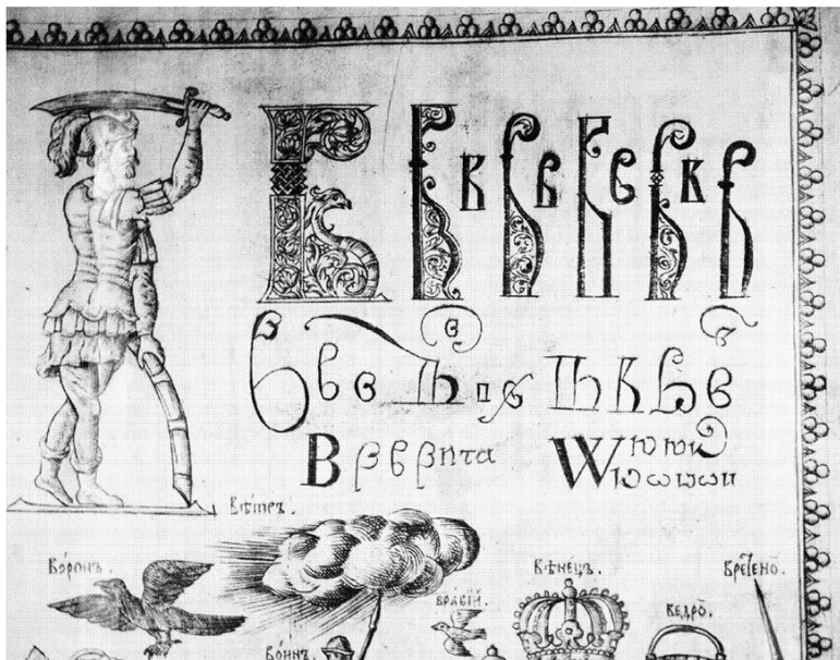
Рис. 4. Страница из букваря конца XVII века (Москва, ГИМ)

Причина ясна, если вы вспомните расположение города Владимира в центре мира: русские/славяне в Средние века жили по всей Европе, говорили на русском, а пользовались разными алфавитами. «Знаки разные, язык – единый» – как сказал один талантливый человек. Нужно было просто знать написание букв в иностранных словах, чтобы понимать, о чём идёт речь в тексте. Приведу доказательства.