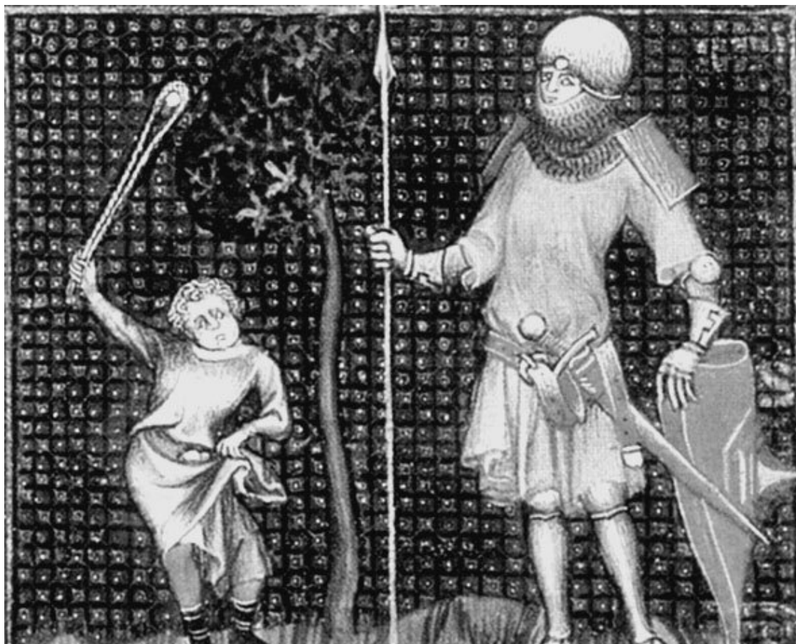
Давид против Голиафа. С картины XIII в.

Царь сплотил нацию, создал регулярную армию, усилил охрану границ и установил новую систему правления. Он перенес ковчег Завета в Иерусалим, начал строить Храм и искоренил идолопоклонство.