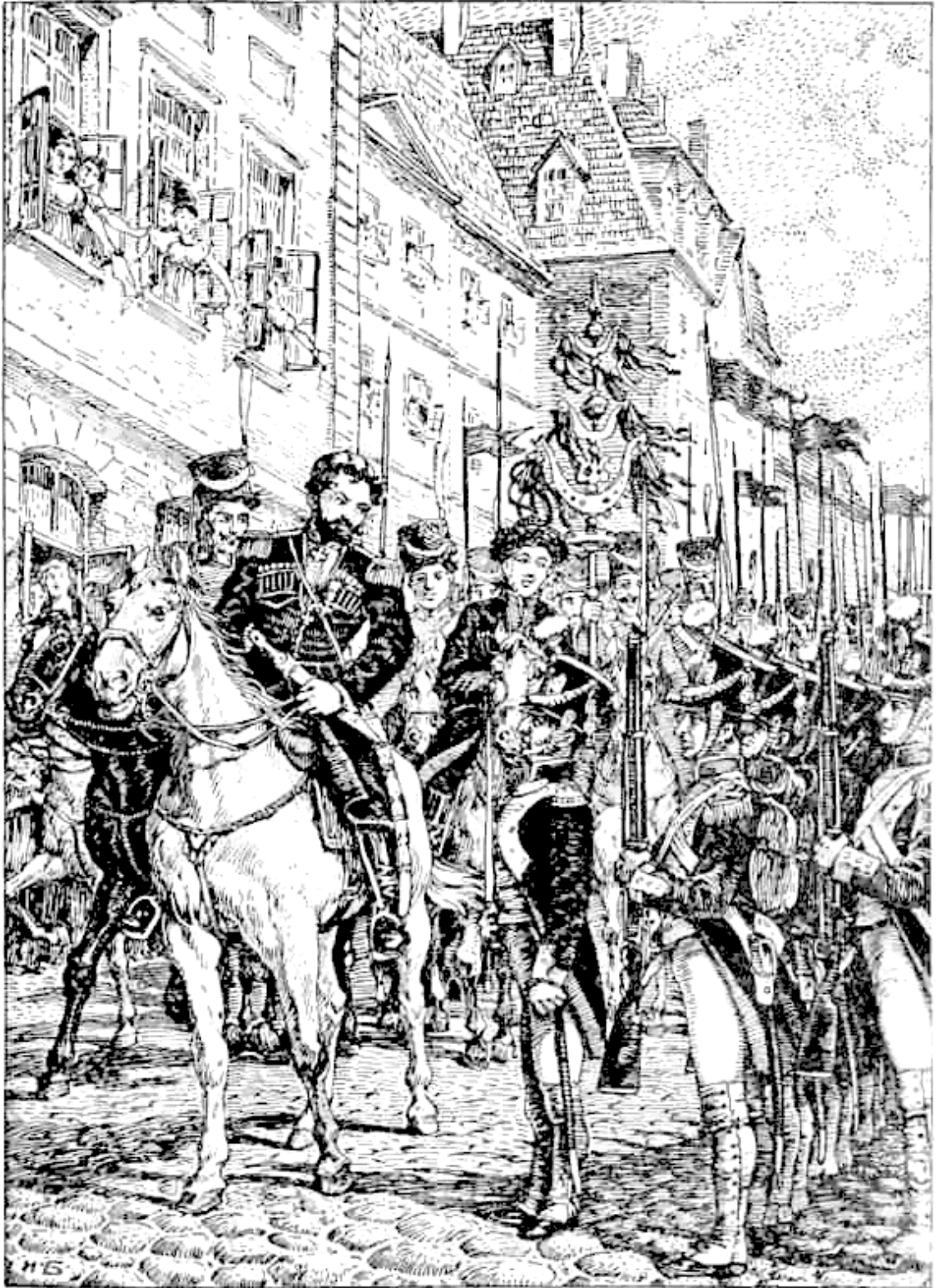
Денис Давыдов въезжает в Дрезден