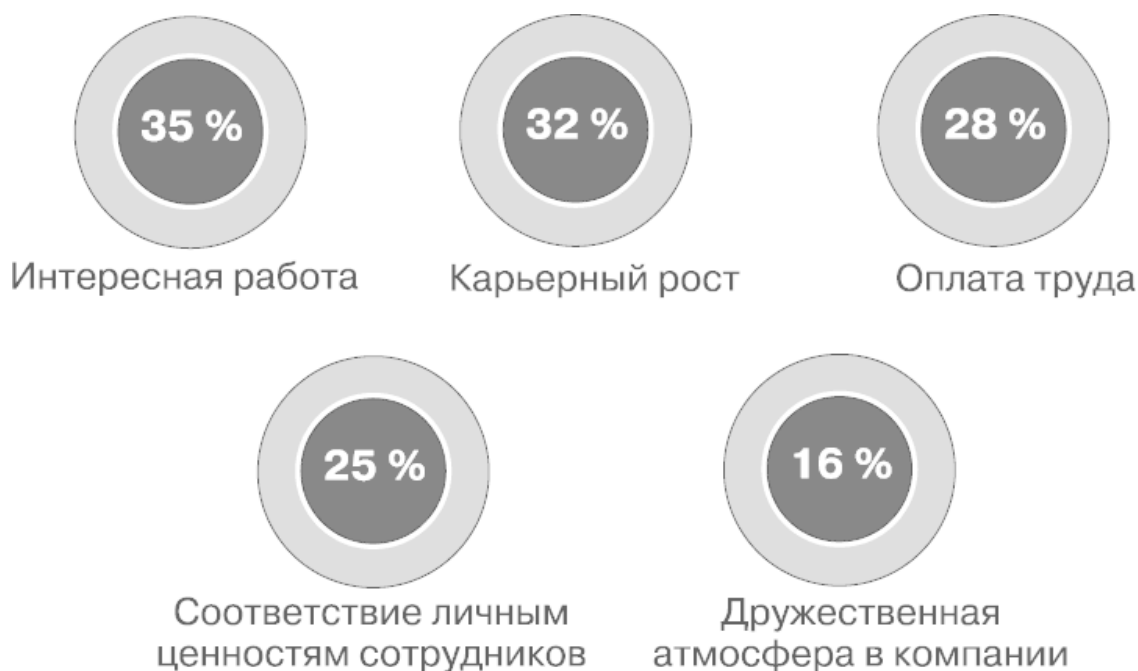
Диаграмма 1. Пять наиболее важных атрибутов ценностного предложения сотруднику (EVP) – глобальные результаты

Прошло то время, когда компании имели несколько заметно отличающихся EVP (ценностное предложение сотруднику, основное послание HR-бренда) для разных стран или разных целевых групп. Сегодняшняя тенденция – одно глобальное EVP, адаптированное в зависимости от локальных, культурных или социальных различий целевых аудиторий. 10 Каждая компания, безусловно, должна иметь «душу» – набор базовых ценностей, которые определяют, чем она является и к чему стремится. Однако восприятие людей из разных стран или социальных групп может существенно отличаться, и сотрудники, работающие в различных подразделениях компании, хоть и связывают с ней один и тот же набор ценностей и преимуществ, но по-разному ранжируют их. То есть в зависимости от того, какие характеристики работодателя важны для них, они придают большее или меньшее значение конкретным преимуществам компании. Результаты недавнего совместного исследования Employer Brand International (EBI) и HeadHunter показывают, что топ-5 наиболее важных атрибутов привлекательного работодателя в России отличается от глобального топ-5.