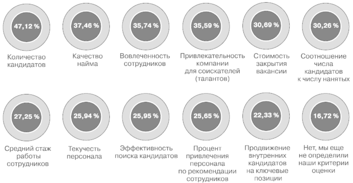
Диаграмма 3. Какие ключевые показатели вы используете для оценки своей деятельности в области HR-брендинга?

Проекты участников «Премии HR-бренд», которые я представляю вашему вниманию в следующих главах книги, наглядно подтверждают, что сильный бренд работодателя – важнейшее конкурентное преимущество компании в современных экономических условиях.