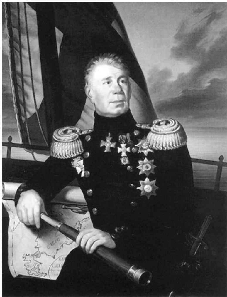
Адмирал Иван Фёдорович Крузенштерн (1770-1846)