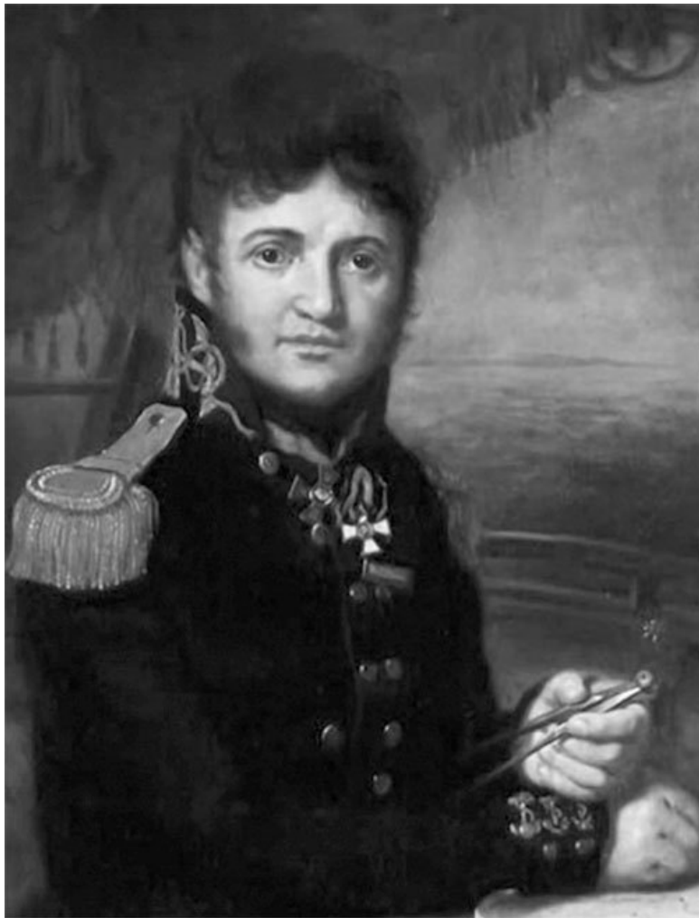
Капитан 1-го ранга Лисянский Юрий Федорович (1773 –