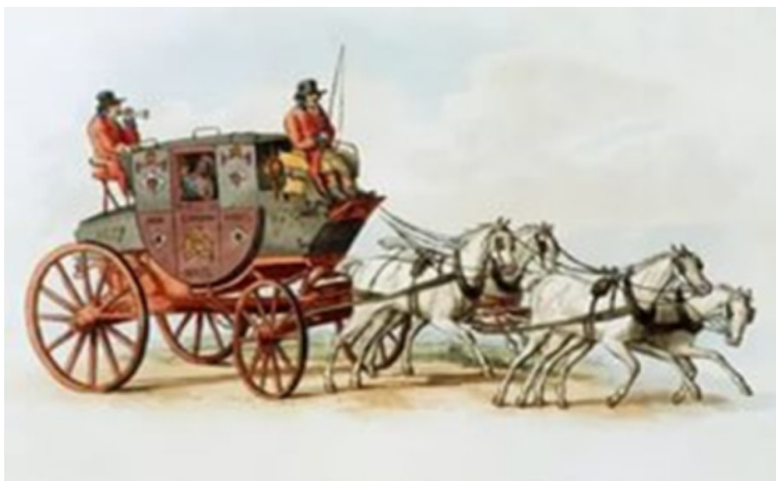
Рис. 5 – Конный дилижанс

По многим дорогам начали выполнять перевозки пассажиров дилижансы (рис. 5).