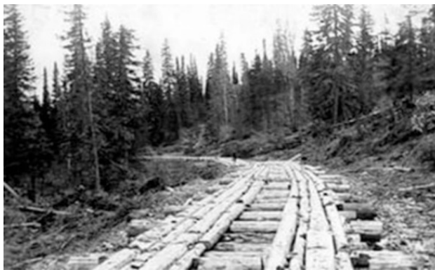
Рис. 4 – Дорога с бревенчатым настилом

Объединение княжеств вокруг Москвы привело к созданию сети дорог – путей, ведущих в соседние страны и территории – Великому княжеству Литовскому, Польшу, на юг в Крым, Среднюю Азию, Сибирь, к Белому морю. Например, Владимирская дорога, удобная и сравнительно прямая, соединила основные центры развивающегося Московского княжества: Москву, Владимир и Нижний Новгород.