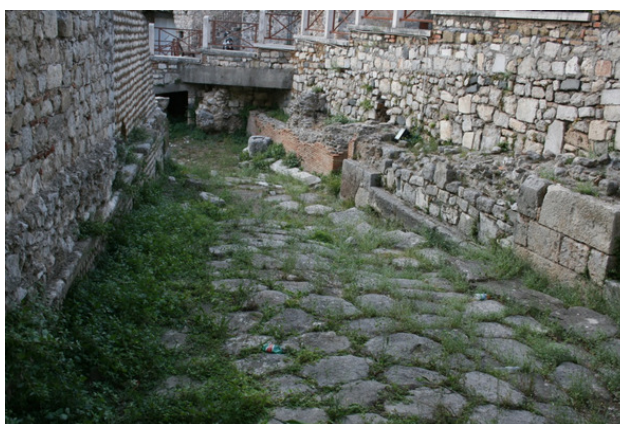
Рис. 2 – Дороги древнего Рима (г. Террачино, Италия)

Транспортные проблемы в крупных городах возникли задолго до появления автомобиля. Еще при Юлии Цезаре в 47 г. до н.э. движение колесниц запрещалось в течение первых 10 часов после восхода солнца для упорядочения движения транспорта на некоторых узких улицах Рима, имевшего в то время уже около миллиона жителей было введено одностороннее движение для конных повозок.