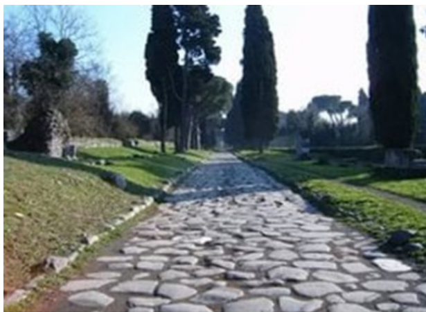
Рис. 3 – Аппиева дорога

Представление о римских дорогах дошли до нас по различным документам. Особый интерес представляет сохранившийся список дорожных станций для обмена лошадей и расстояния между ними. Это список был составлен по приказу императора Марка Аврелия Антонина (161—180 гг. до н.э.). Основные дороги Рима имели имена: Аппиева дорога, Фламиниева дорога, дорога Корнелия. Самой главной Рима была царица дорог – Аппиева дорога («Виа Аппиа»), построенная в 312 г. до н.э. и названная в честь цензора Аппия Клавдия (рис. 3). Вот как путешествие по ней описывал Прокопий Кесарийский – византийский историк, совершивший по ней в IV веке н.э. путешествие, когда возраст дороги насчитывал около 850 лет. «Аппиева дорога длиной в пять дней пути для идущего без багажа человека, она ведет из Рима в Капую. Ширина этой дороги такая, что на ней могут разъехаться две встречные повозки, и из всех дорог она наиболее замечательная. Весь камень для неё, являющийся таким же, как в жерновах, и твердым по природе, Аппий выламывал и привозил сюда изделия из другой области. В этой стране его нигде нет.