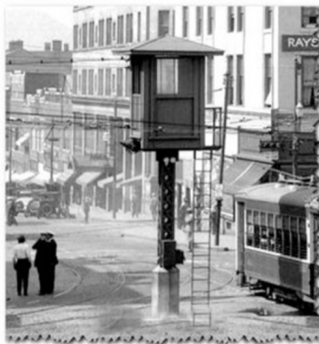
Рис. 7 – Первый светофор, установленный в Лондоне в 1868 г.

Смена неосвещенных, раскрашенных сигналов осуществлялась при помощи системы приводных ремней. По этому поводу полиция выпустила листовку с объяснением населению значений сигналов светофора.