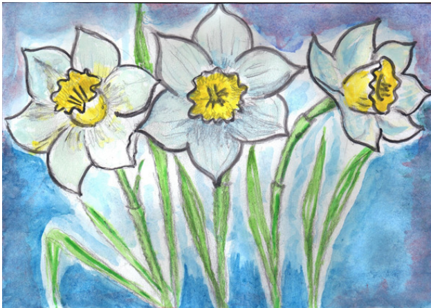
Рисунок Татьяны Абрамовой.

Эхом летели легенды и притчи, Гулко, протяжно к Нарциссу зывали, Нимфа, влюблённая в этого принца, Даже шаги все за ним повторяла.