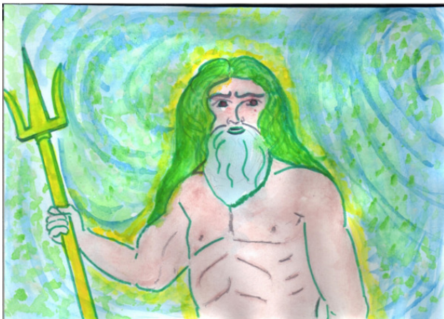
Рисунок Татьяны Абрамовой.

Белые кони с зелёною гривой... Как усмирить этих резвых коней? Быстрой волною, лёгкой, игривой, С ветром помчались они в табуне.