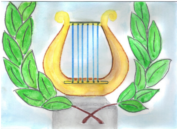
Рисунок Татьяны Абрамовой.