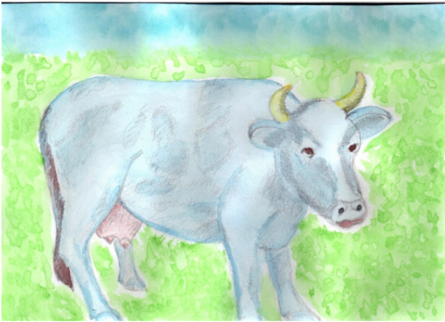
Рисунок Татьяны Абрамовой.