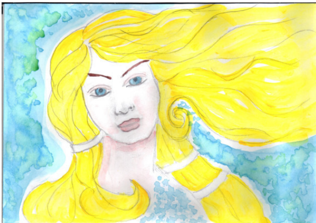
Рисунок Татьяны Абрамовой.