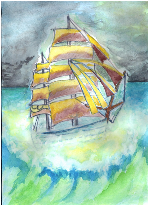
Рисунок Татьяны Абрамовой.

Деккен проклял бога, а кара – поныне... Но души спасения ждут,