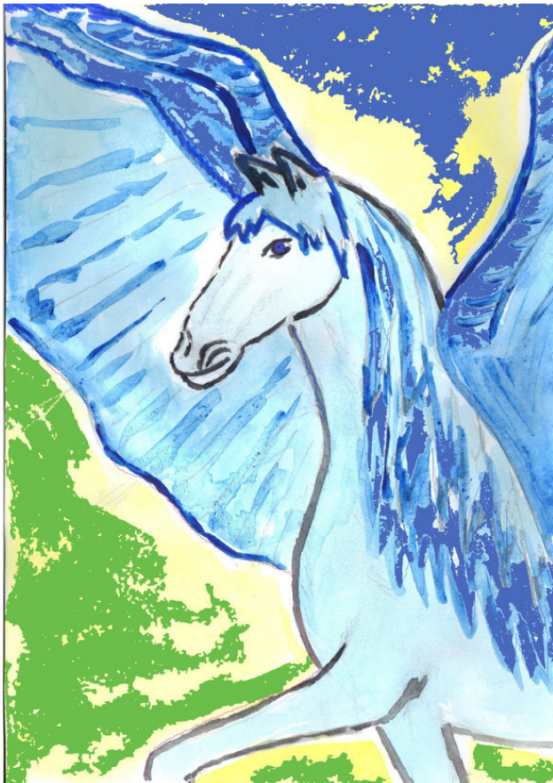
Рисунок Татьяны Абрамовой