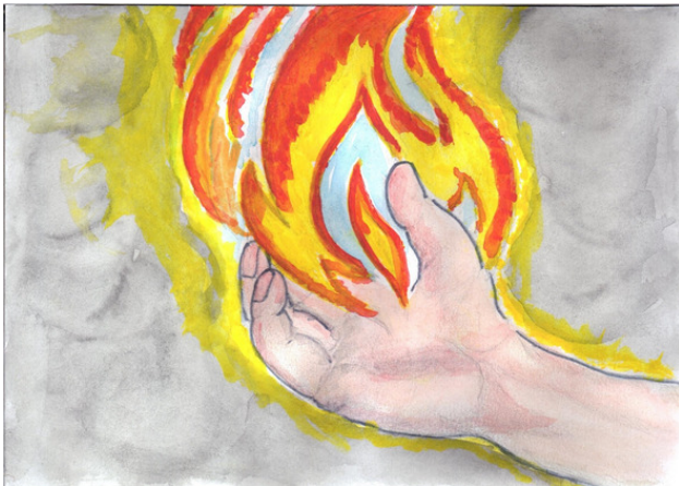
Рисунок Татьяны Абрамовой.

Как избежать мне наказания, И положить конец страданиям, А вещей старец Океан, Ты покоришься, увещевал, Рыдали с ним океаниды, Страдала мать его Фемида, Со страшным грохотом скала Упала снова в бездну зла... Но он пришёл, один из смертных, Сильнее бога, царства смерти, Летела звонкая стрела, И гриф упал к подножью зла. В ущелье мрачных скал-титанов