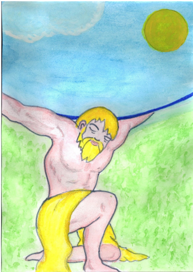
Рисунок Татьяны Абрамовой.