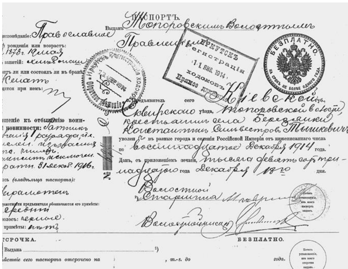
Временный паспорт ходока.