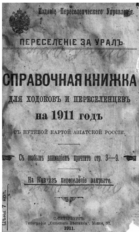
В некотором роде путеводитель для переселенцев