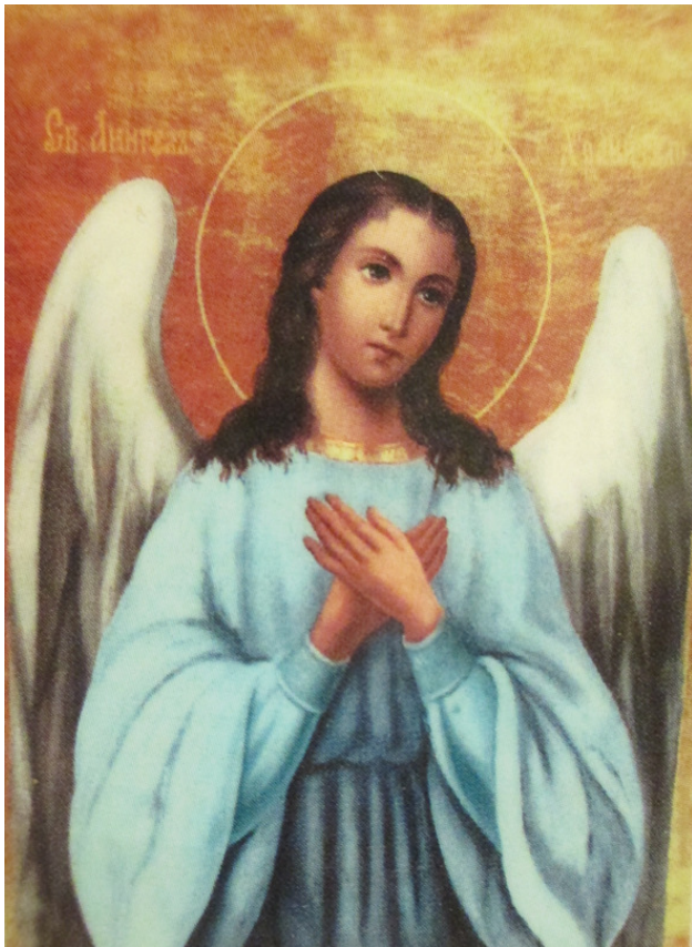
Ангел – Хранитель