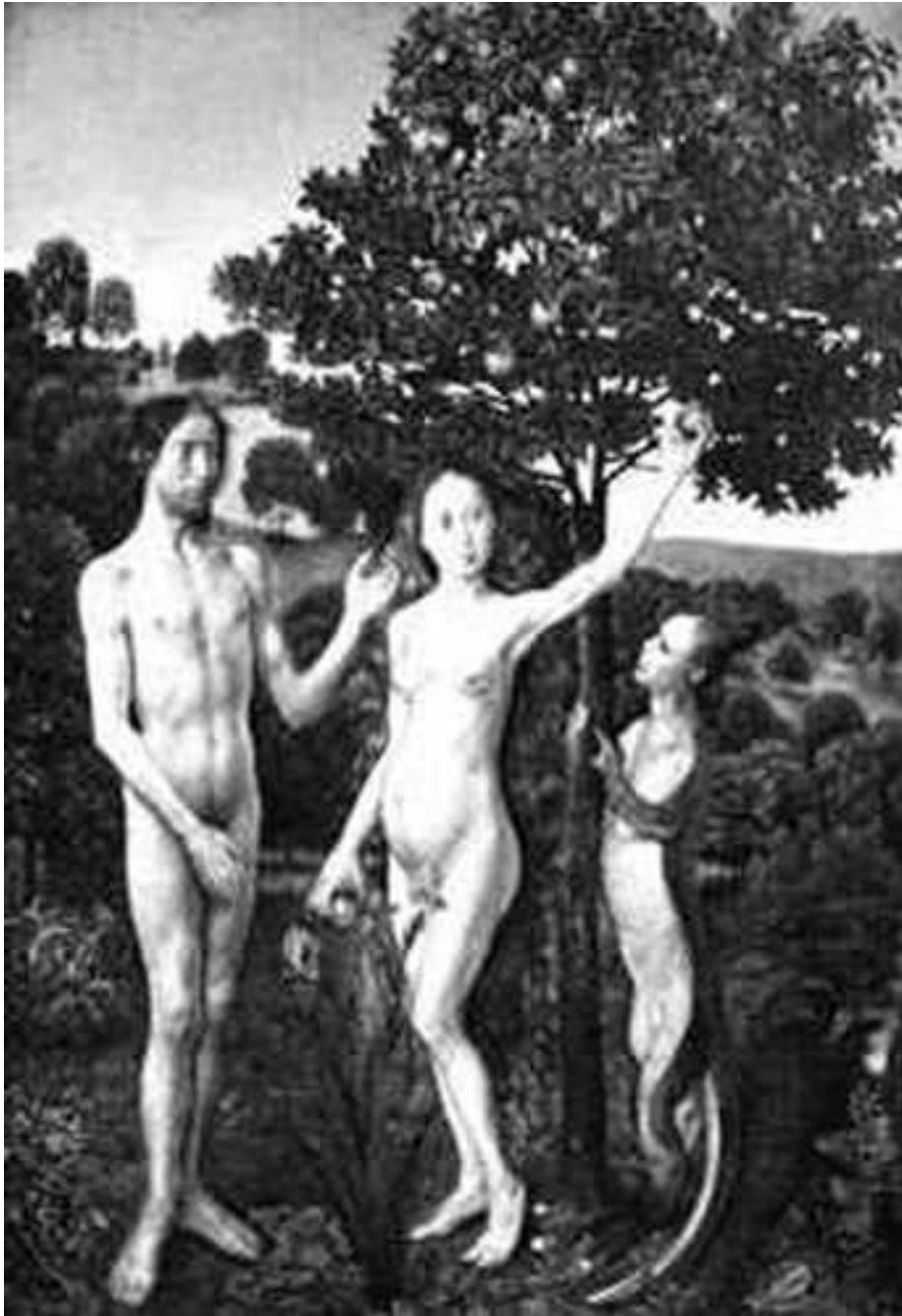
Микеланджело Буонарроти. Фреска в Сикстинской Капелле.

Лилит изображена наполовину как женщина, наполовину как змея. Своенравная Лилит ответила ангелам категорическим отказом.