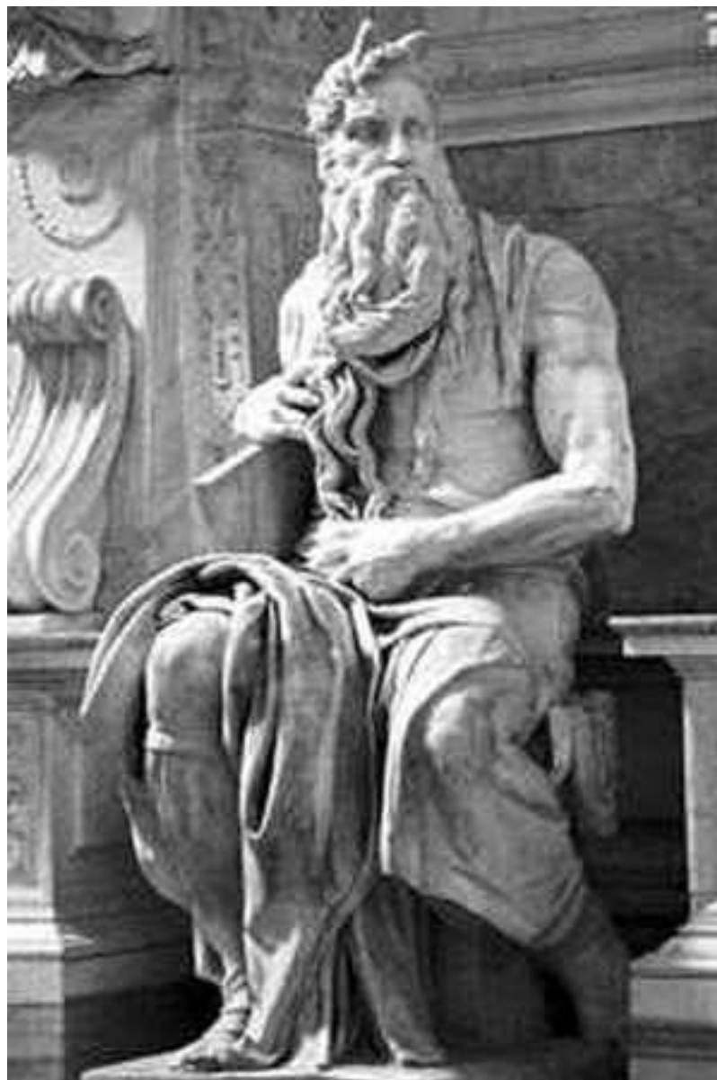
Микеланджело Буонарроти. Моисей

А вот с латинским переводом Торы «Вульгата» произошёл и вовсе курьёз. На иврите слово «керен» имеет два значения – «луч» и «рог».