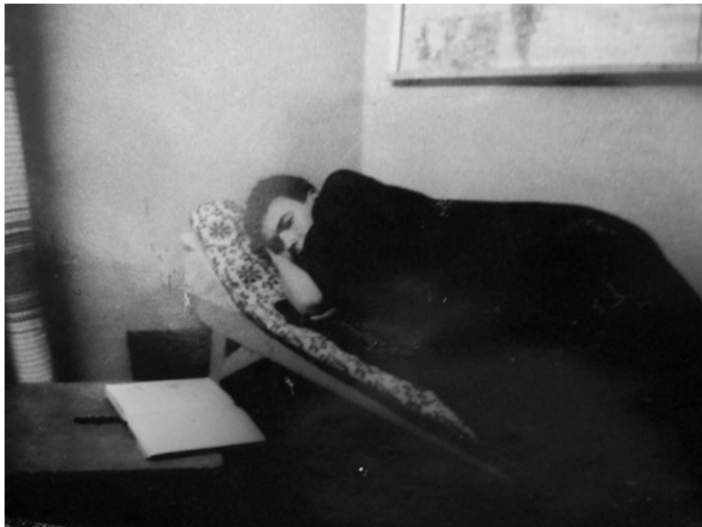
я на боевом дежурстве

Когда я отчаялся вырваться из замкнутого круга нарядов в караул, дневальным по роте и нарядов в столовую, меня неожиданно допустили к боевому дежурству. Счастью своему я не верил – отдельная комната, топчан, собственный шкаф... Пещера Алладина не шла ни в какое сравнение с моей сказкой.